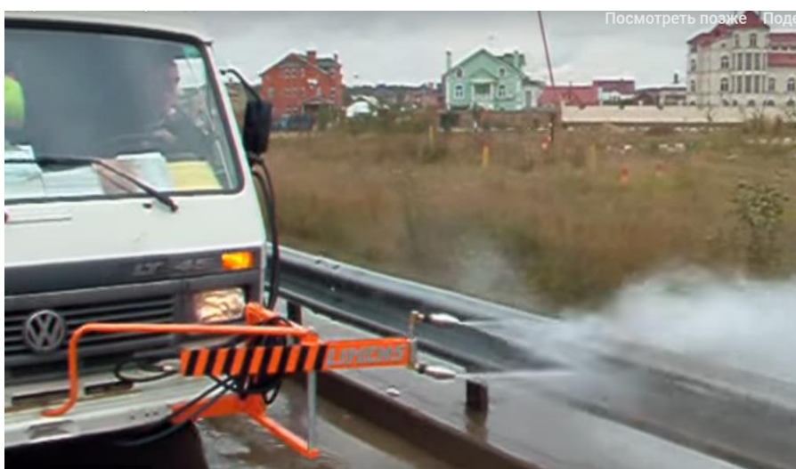
Рисунок 3 – Мойка дорожных ограждений с использованием агрегатов ЛМ

Нами предлагается устройство, позволяющее осуществлять бесконтактную мойку дорожных ограждений многополосных магистралей с двух сторон за один проход агрегата (рисунок 4).