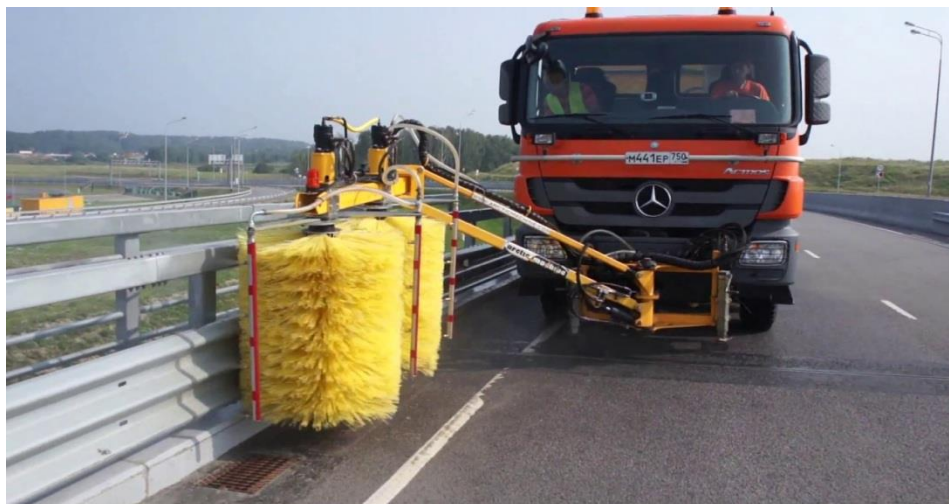
Рисунок 2 – Мойка дорожных ограждений с использованием щеточных рабочих органов

В России дорожные ограждения моют преимущественно щеточными механизмами на базе коммунальных уборочных машин (механический способ очистки) (рисунок 2).