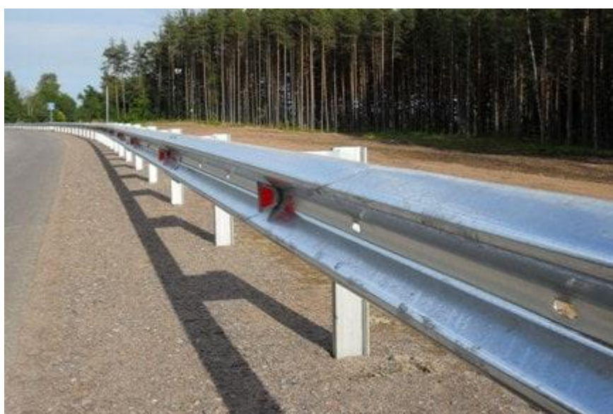
Рисунок 1 – Дорожное ограждение со светоотражающими значками

Поэтому актуальны исследования по разработке технического средства для очистки дорожных ограждений от загрязнений, использование которых повысит качество их очистки, а также позволит увеличить производительность дорожных машин.