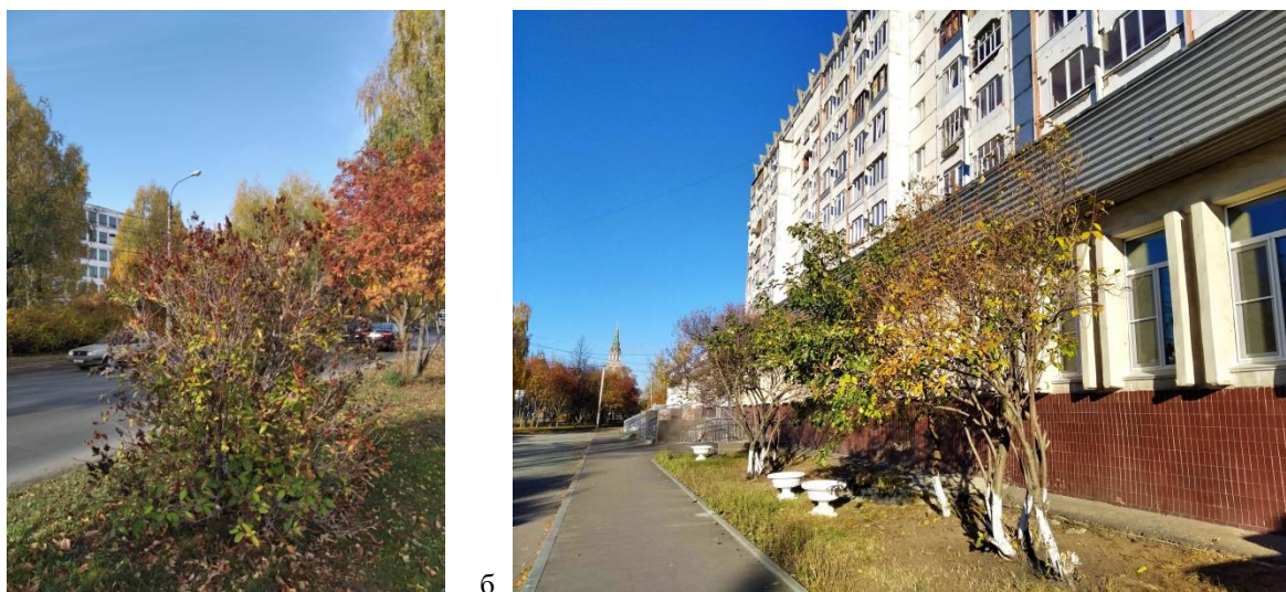
Рисунок 3 – Общий вид сирени из секции волосистых сиреней на участках: а) – № 6; б) – № 3

насаждениями ведется профессиональный уход. На участке № 3 кустарники расположены в придомовой полосе с западной стороны здания, от проезжей части улицы они защищены широкой полосой насаждений сквера. На участке № 4 произрастает наибольшее количество растений – 15 экз., они находятся в придомовой полосе с южной стороны жилого здания, имеют хорошо развитую крону, обильно цветут и плодоносят. Несмотря на близость оживленной улицы, кустарники находятся в благоприятных микроклиматических условиях и могут стать отличными маточниками для сбора семян с целью семенного размножения. В целом, однофакторный дисперсионный анализ не выявил значимого влияния фактора расположения участка на всхожесть семян ( F_{\text{факт.}}=1,05 < F_{\text{крит}}=3,87 ).