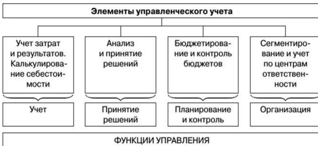
Рисунок 1 – Элементы управленческого учета в организации АПК.

Элементы управленческого учета реализуются на стадии учета, принятия решений, планирования и контроля, организации управленческой учетной системы (рисунок 1).