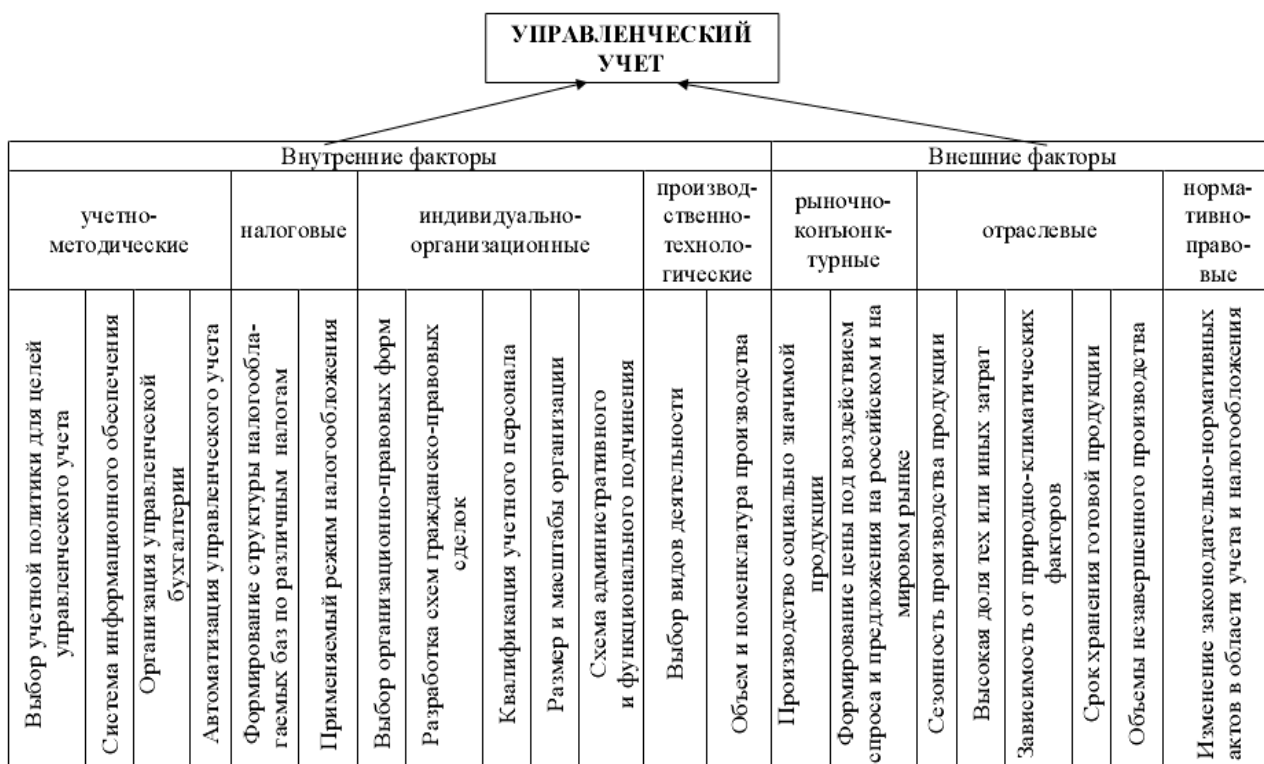
Рисунок 1 – Совокупность факторов, влияющих на функционирование системы управленческого учета.

Система управленческого учета постоянно находится под воздействием внутренних и внешних факторов, оказывающие весомое влияние на его организацию, применяемые методические подходы и приемы (рисунок 1).