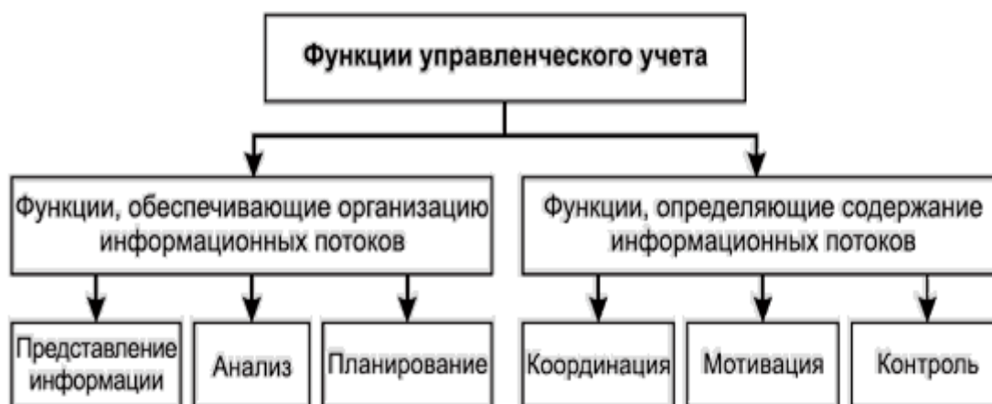
Рисунок 3 - Функции управленческого учета в информационной системе организации.

Понимание сущности управленческого учёта с позиции обеспечения экономической безопасности позволяет выявить зависимость функций, выполняемых этим видом учёта, от функций управления (рисунок 3).