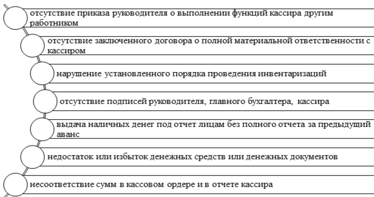
Рисунок 3 – Типичные ошибки, выявляемые в ходе аудита денежных средств.

Выделяют следующие типичные ошибки, выявляемые в ходе аудита денежных средств: отсутствие приказа руководителя о выполнении функций кассира другим работником, отсутствие заключенного договора о полной материальной ответственности, нарушение порядка проведения инвентаризаций, отсутствие на документах подписей руководителя и главного бухгалтера, несоответствие сумм в кассовых ордерах и отчете кассира и другие (рисунок 3).