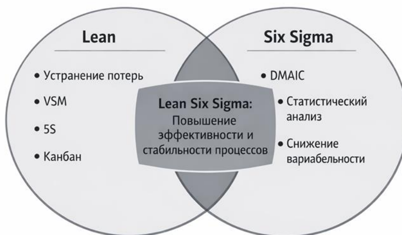
Рисунок 2 – Интеграция методологий Lean и Six Sigma в системе управления качеством.

Методология «Шесть сигм» (Six Sigma) представляет собой статистически ориентированный подход к снижению дефектности процессов. Основой методологии является цикл DMAIC (Define–Measure–Analyze–Improve–Control), включающий определение проблемы, измерение параметров процесса, анализ причин отклонений, улучшение и контроль достигнутых результатов. Применение статистических методов позволяет достичь высокого уровня стабильности процессов - не более 3,4 дефекта на миллион возможностей. В современных организациях часто используется интеграция Lean и Six Sigma, что обеспечивает одновременное сокращение потерь и снижение вариабельности (рисунок 2).