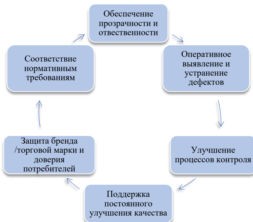
Рисунок 2 – Роль системы прослеживания в управлении качеством продукции.

Схематично роль системы прослеживания в управлении качеством продукции отражена на рисунке 2.