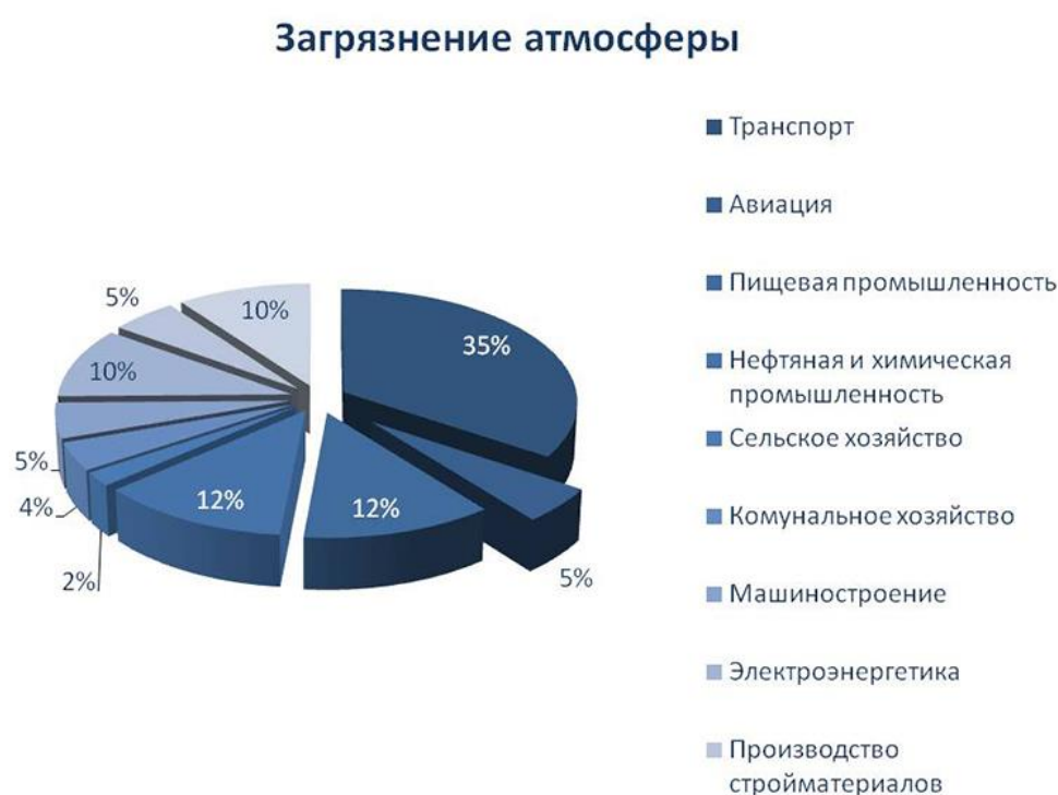
Рисунок 1 – Диаграмма загрязнения атмосферы

Автомобили являются одним из основных источников вредных выбросов, поступающих в окружающую среду. На рисунке 1 представлена диаграмма загрязнения атмосферы под действием различных факторов.