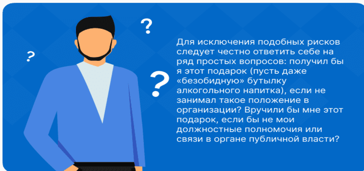
Рисунок 3 – Основания для служебных проверок

При этом информация анонимного характера не может служить основанием для проверки. Информация о присутствии в действиях проверяемого признаков преступления или административного правонарушения сразу направляется в правоохранительные органы в соответствии с их компетенцией.