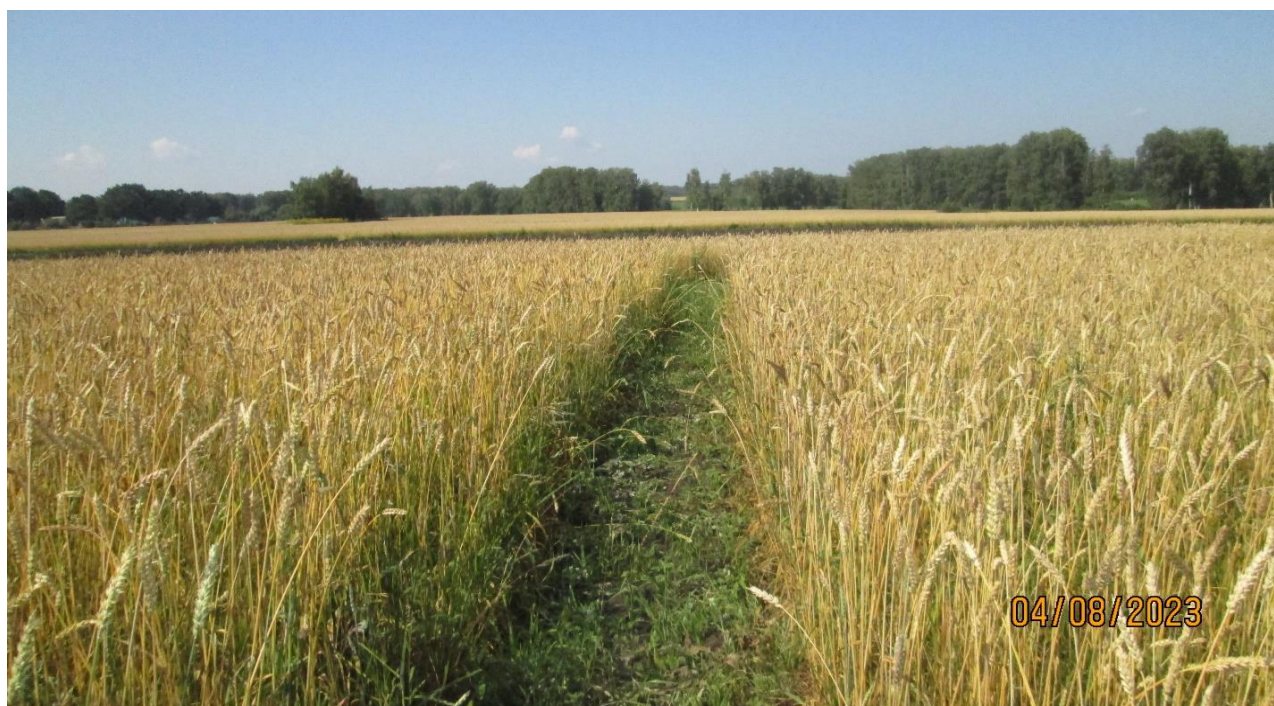
Рисунок 3 – Состояние посевов при оценке устойчивости к полеганию

В течение вегетации яровой пшеницы неоднократно шли дожди с ветром. Тем самым создавались условия, которые могли повлечь полегания растений.