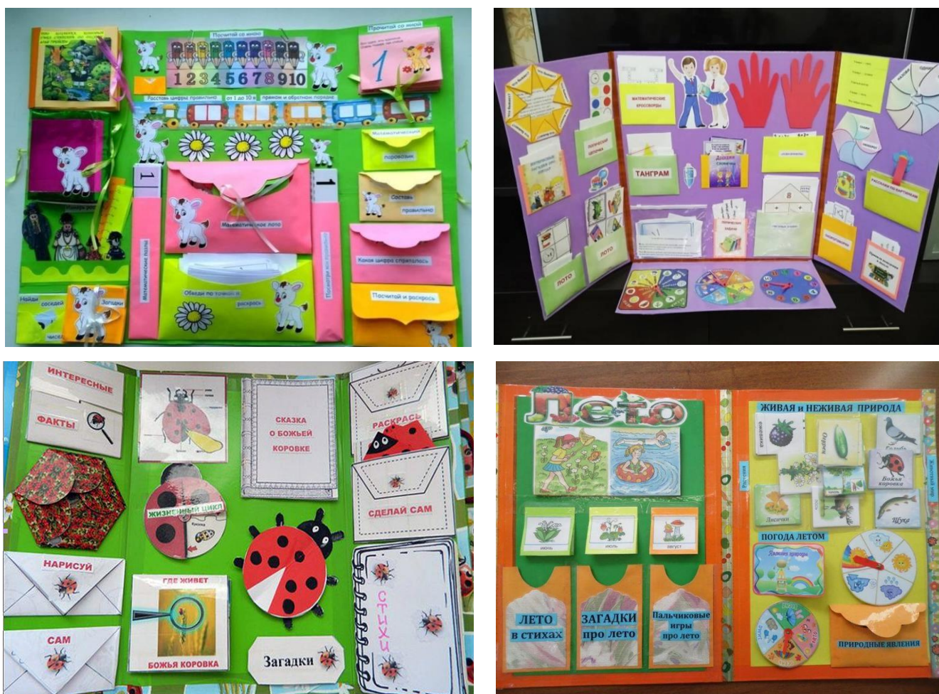
Рисунок 2 – Разнообразие лэбуков для дошкольников.

5) оформление лэбука (рис. 2) является практическим видом деятельности. Воспитанники самостоятельно или совместно с родителями работают над оформлением собственной книги, лэбука [3].