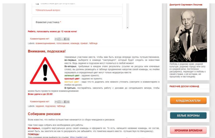
Рисунок 1 – Ссылки на электронные доски команд на главной странице сайта

Помимо вышеперечисленных ссылок на главной странице располагаются ссылки на основные этапы квеста.