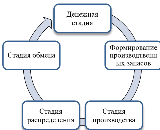
Рисунок 1 - Схема кругооборота оборотных средств.

выручка, а не валовая продукция как при оценке эффективности основных средств. Рассчитанные на этой основе показатели характеризует оборачиваемость оборотных средств.