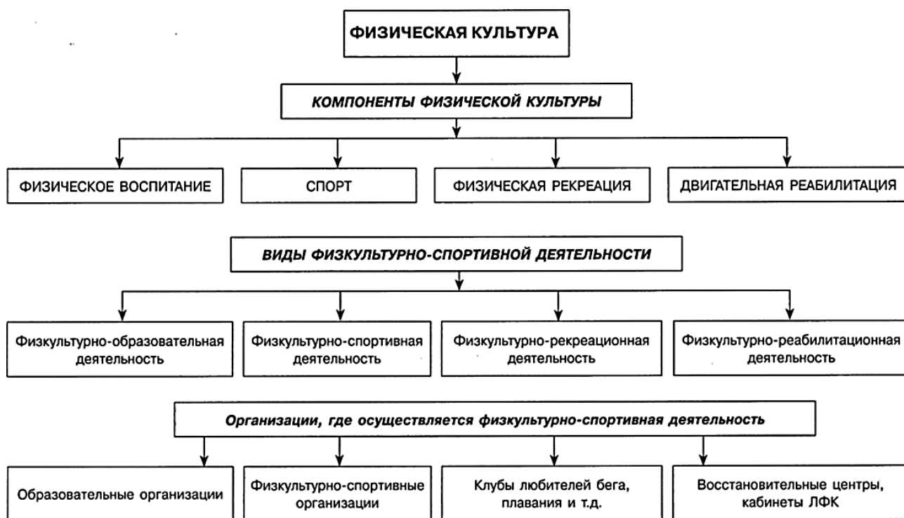
Рисунок 1– Управление в сфере физической культуры

Физическая культура включает в себя широкий спектр физических и спортивных занятий, направленных на развитие физических качеств, укрепление здоровья, поддержание физической формы и общее благополучие человека. Таким образом, мы видим, что физическая культура играет важную роль в общем развитии личности человека, помогая ему сохранить здоровье, достичь физической формы, развить спортивные навыки и научиться жить здорово и активно [7].