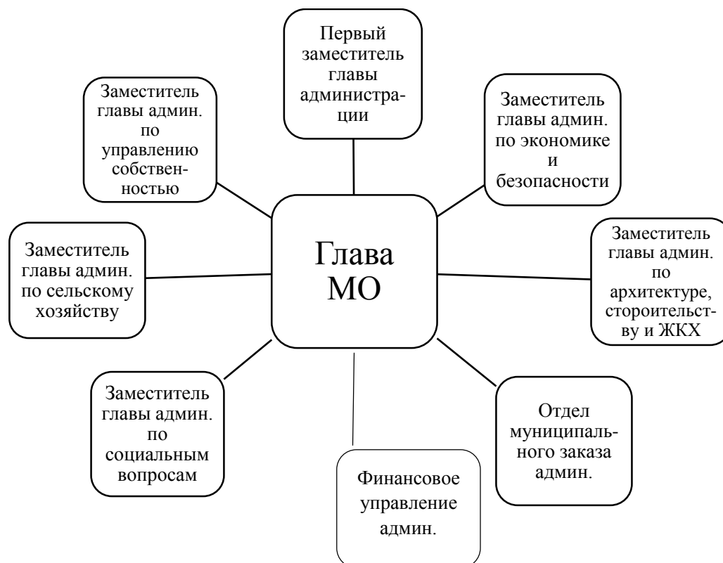
Рисунок 2 – Структура администрации

В составе администрации создаются отделы и другие структурные подразделения, непосредственно подчиненные главе МО, которые представлены на схеме 2.