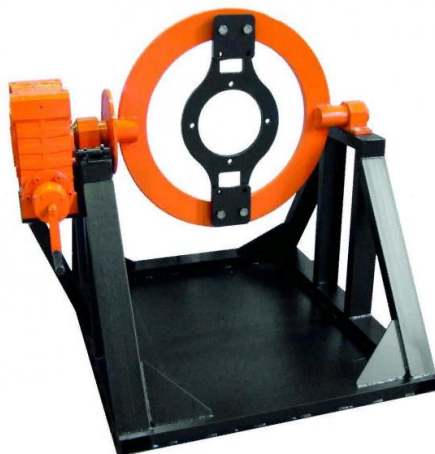
Рисунок 5 - Стенд-кантователь для разборки и сборки дифференциала главной передачи SDMT

Стенд-кантователь для разборки и сборки дифференциала главной передачи SDMT предназначен для облегчения работ по сервисному обслуживанию и ремонту дифференциала главной передачи. [6, 7]