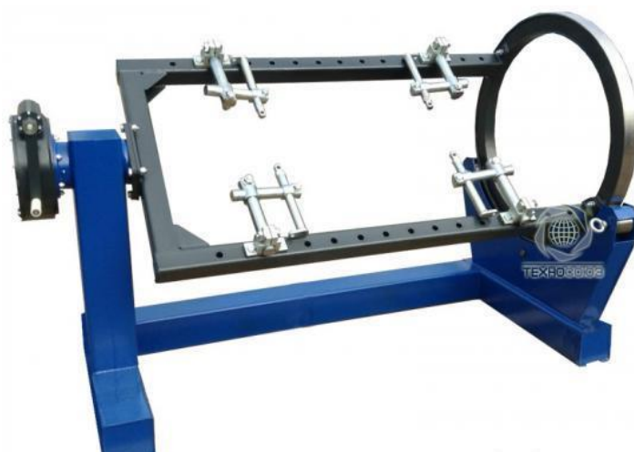
Рисунок 4 - Стенд P776E

Стенд-кантователь для разборки и сборки дифференциала главной передачи SDMT предназначен для облегчения работ по сервисному обслуживанию и ремонту дифференциала главной передачи. [6, 7]