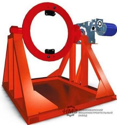
Рисунок 2 - Стенд SRBB

Стенд крепится к полу при помощи анкеров под которые в основании стенда предусмотрены отверстия.