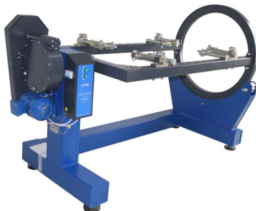
Рисунок 3 - Стенд P770E

Стенд является универсальным и спокойно помогает ремонтировать различные вышеописанные механизмы используя для этого специальные адаптеры. Поворот ремонтируемых механизмов обеспечивается при помощи червячной пары.