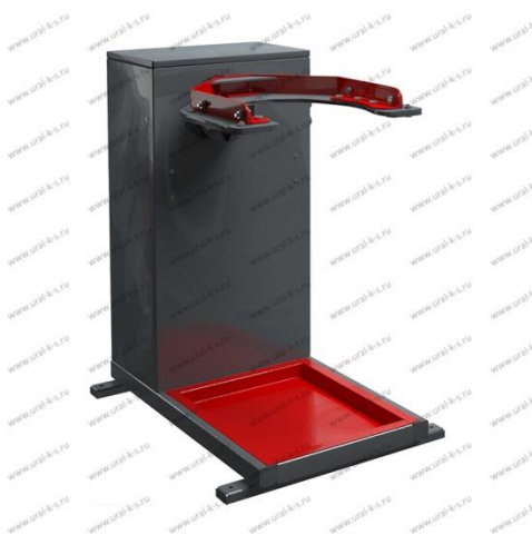
Рисунок 1 - Стенд-кантователь для разборки и сборки редуктора главной передачи (заднего моста) Р-260

Состав не передвижаемой модификации имеет большие габариты и вес из-за того что ремонтирует задние мосты техники больших размеров. Пуск устройства происходит вручную.