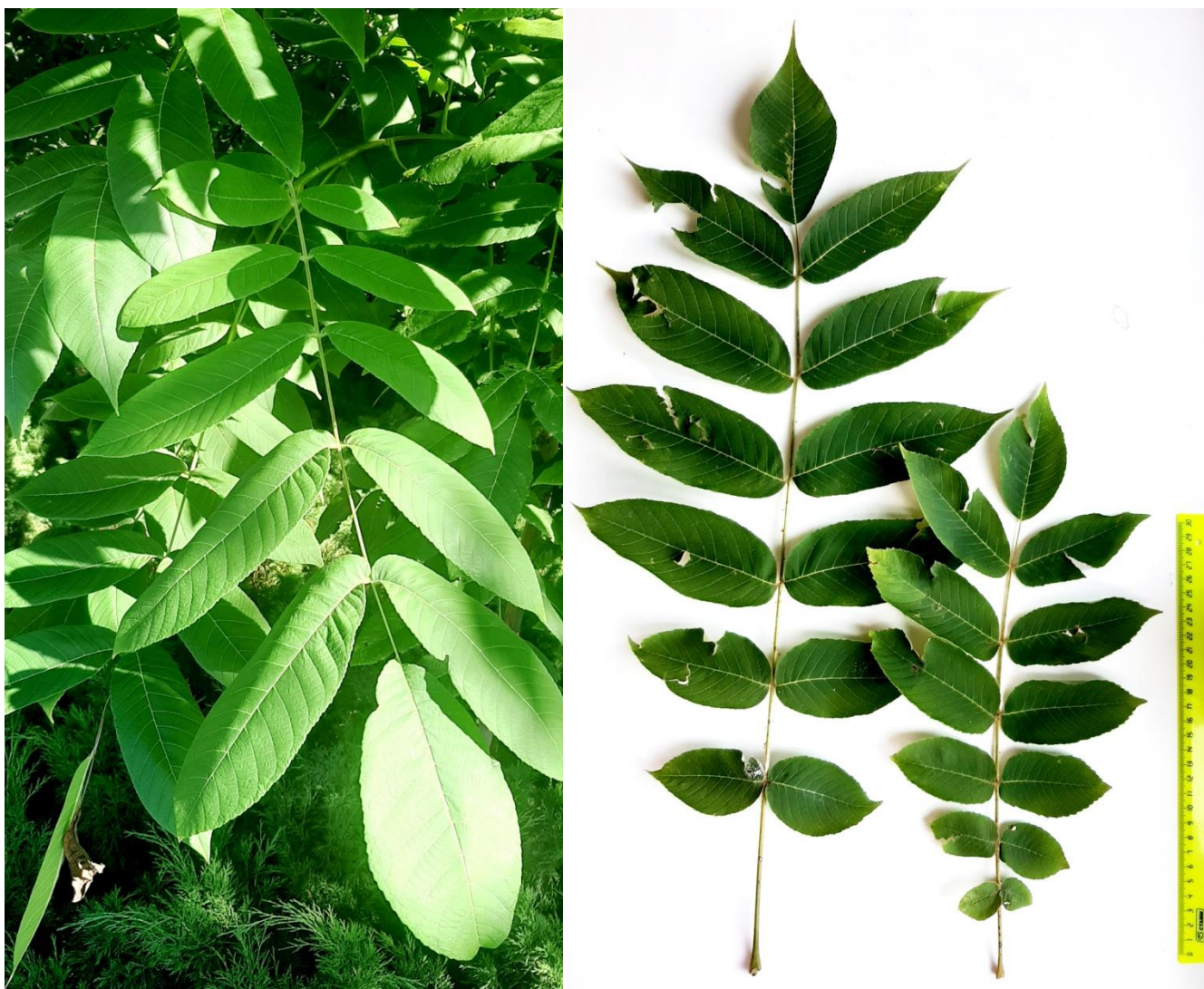
Рисунок 1 – Морфометрические показатели листовой пластинки ореха маньчжурского

Результаты. Фотофиксация параметров листа ореха маньчжурского представлена на рисунке 1.