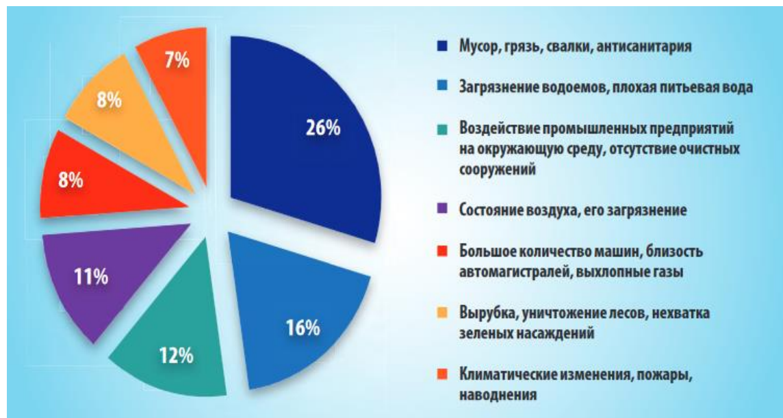
Рисунок 1 - Проблемы, вызывающие наибольшее беспокойство граждан, в сфере экологии (по данным «ФОМнибус»)

Тематика острых проблем в сфере экологии, по мнению россиян, представлена на рис. 1.