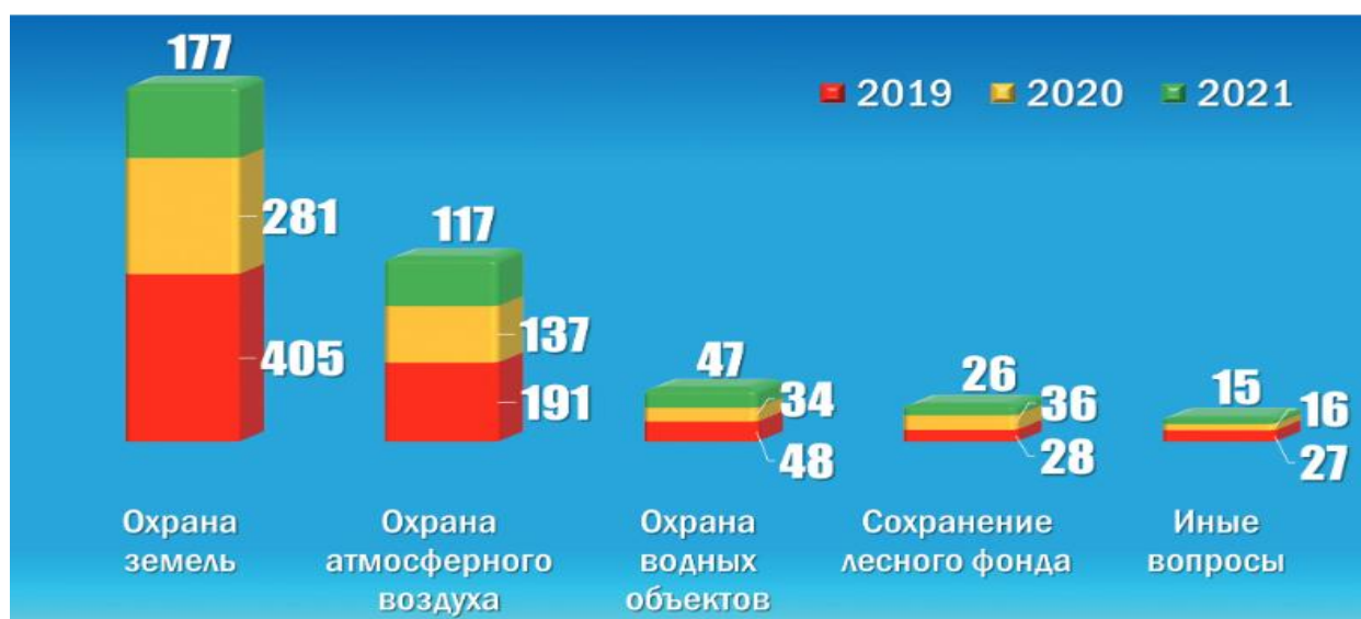
Рисунок 3 - Тематика и количество обращений по вопросам защиты права на благоприятную окружающую среду за 2019–2021 годы

Тематика обращений за последние три года представлена на рис. 3.