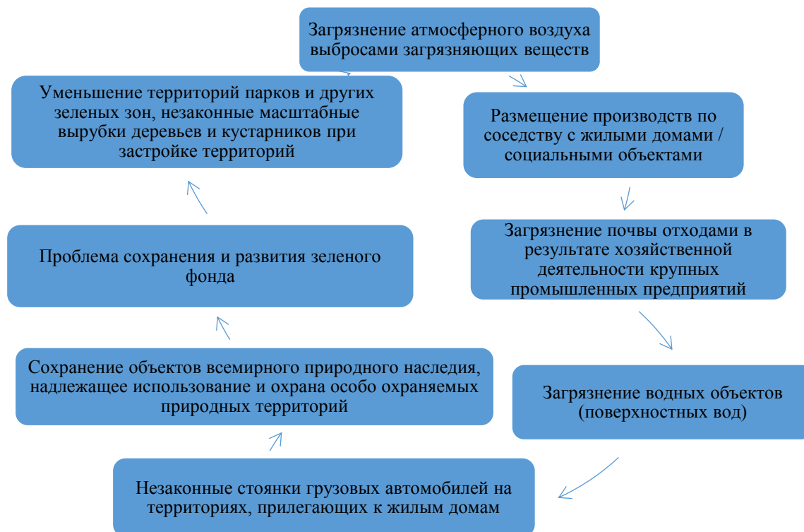
Рисунок 4 — Основные проблемы в области соблюдения и защиты права человека на благоприятную окружающую среду [3-8]

Проанализировав доклады Уполномоченных по правам человека в различных регионах, можно определить ряд общих проблем в области соблюдения и защиты прав человека на благоприятную окружающую среду, основные из них представлены на рис. 4.