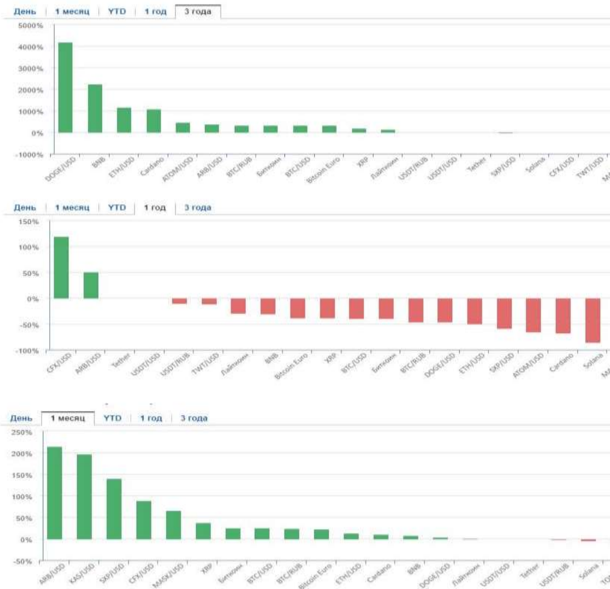
Рисунок 2 - Показатели ведущих криптовалют за три года, один год и месяц на 03.04.2023г.[1]

По данным сайта инвестинг.ком в 2021г. большинство основных криптовалют были, так сказать, на тенденциях роста. Однако уже в 2022 г. стоимость их резко пошла на спад в результате санкций в отношении к России, что вызвало на данный момент мировой кризис.