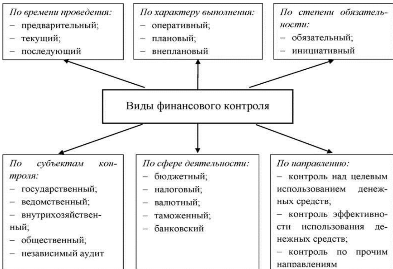
Рисунок 1 - Виды финансового контроля в РФ

В соответствии с Бюджетным кодексом Российской Федерации от 31.07.1998 №145-ФЗ (ред. от 28.12.2022) главной целью функционирования государственного (муниципального) финансового контроля выступает обеспечение соблюдения положений, содержащихся в нормативно-правовых актах в сфере действия бюджетных правоотношений, а также правовых актов, регулирующих нормативные обязательства по выплатам физическим лицам из источников бюджетной системы. Кроме того, основополагающей целью государственного (муниципального) финансового контроля выступает обеспечение неукоснительного соблюдения условий государственных (муниципальных) контрактов, а также договоров или соглашений о выдаче бюджетных средств на различные нужды.