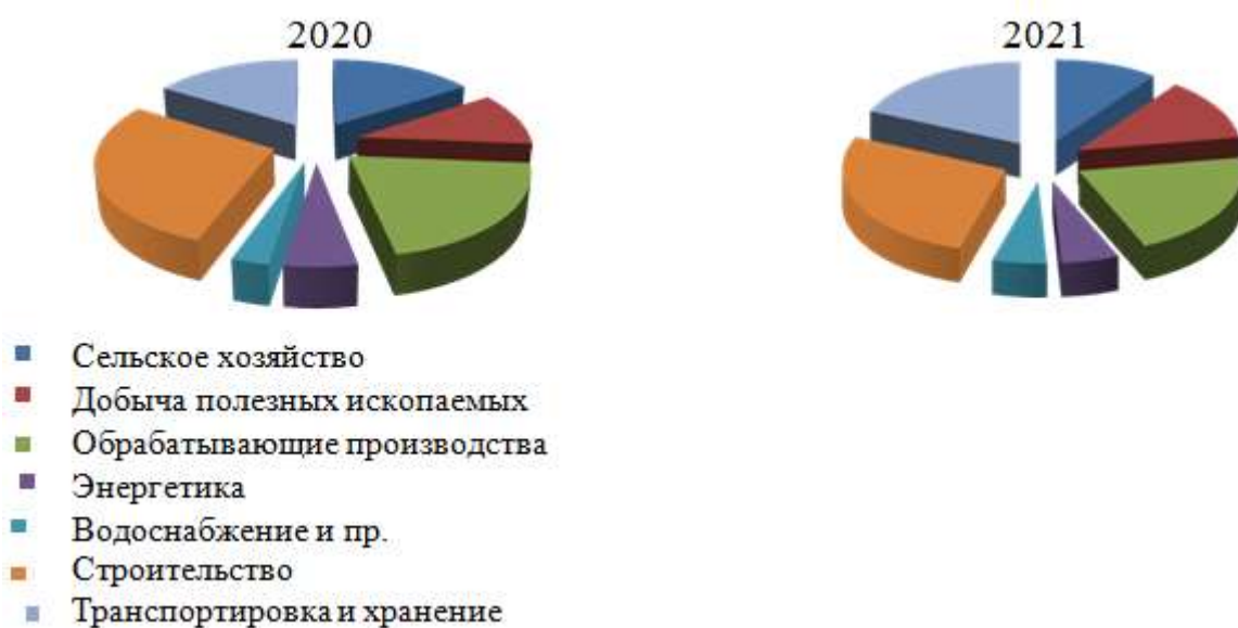
Рисунок 2 – Показатели производственного травматизма со смертельным исходом в Тамбовской области по видам экономической деятельности за 2020-2021 годы

Следует отметить, что по темпам снижения уровня смертельного травматизма лидирует сельское хозяйство. С 2019 года установилось стойкое снижение количества случаев, которое выразилось в том, что, начиная с 2019 года абсолютные значения рассматриваемого показателя ниже среднего значения за рассматриваемый период, рисунок 1.