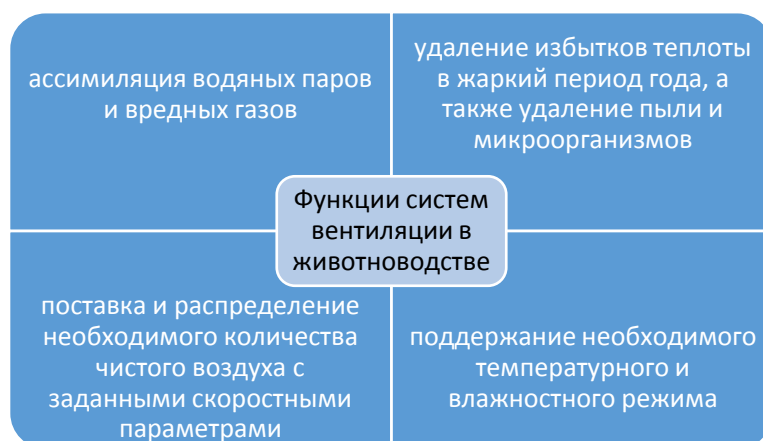
Рисунок 1 – Основные функции систем вентиляции в животноводстве

Как правило, системы вентиляции в животноводстве выполняют следующие функции, рисунок 1.