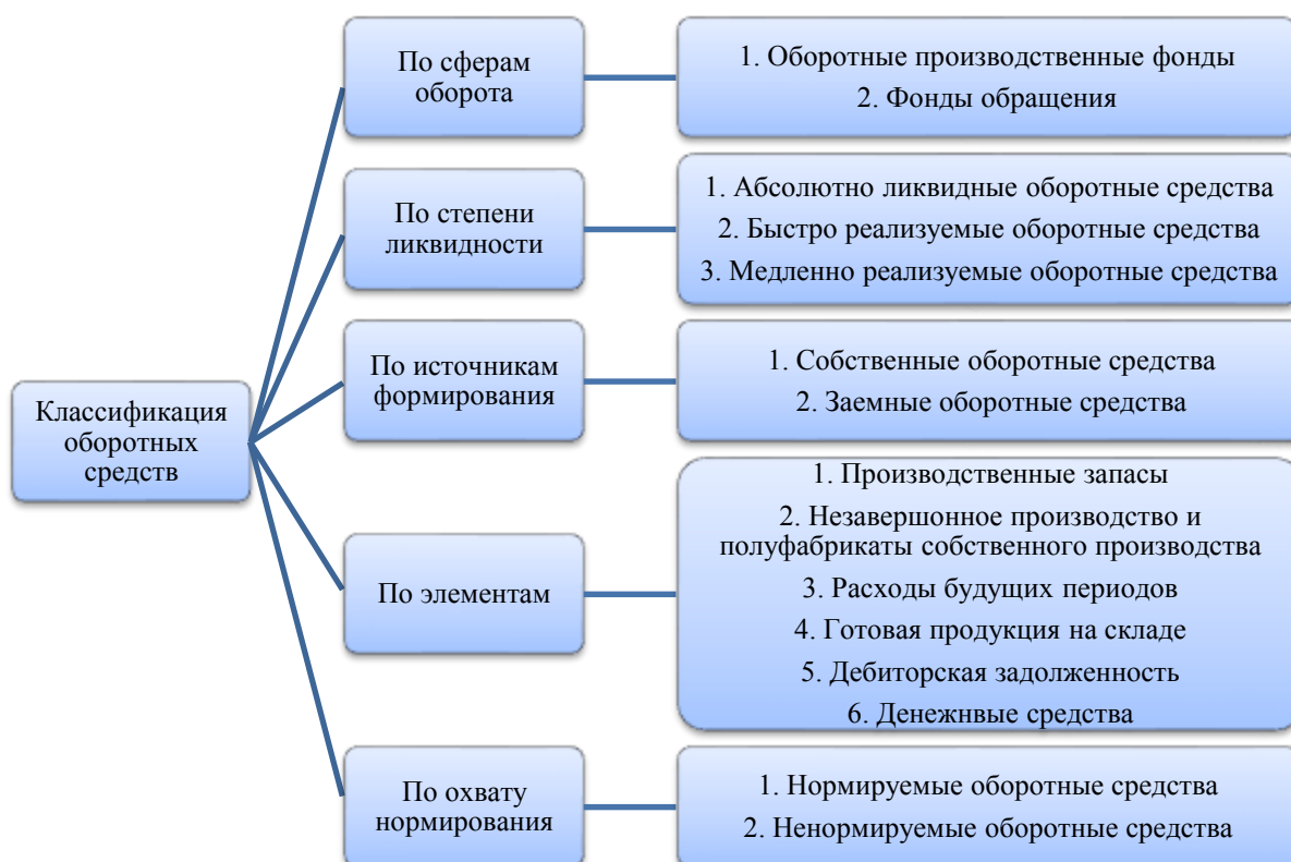
Рисунок 1 – Классификация оборотных средств сельскохозяйственной организации

Данная классификация в полной степени раскрывает виды оборотных средств и отображена на рисунке 1.