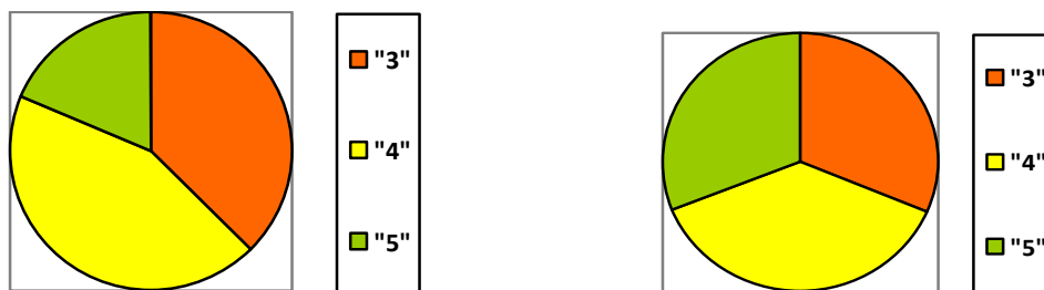
Рисунок 3 – Сравнительный анализ результатов самостоятельных работ по темам «Профессионализмы» и «Диалектизмы»

Данные таблицы и рисунка указывают на позитивные изменения в развитии познавательных интересов обучающихся, что свидетельствует о правильно выбранном методе изучения нового материала и эффективной технологии закрепления изученного на формирующем этапе экспериментальной работы при проведении уроков русского языка в 6 классе.