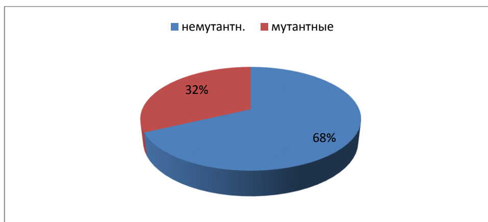
Рисунок 1 - Фенофонд популяция №1- экологически чистый участок (68% растений клевера немутантные и 32% растений мутантных)

число разнообразных фенов. Так, в Популяции №1 (наиболее экологически чистый участок, находится в с. Заворонежское около озера Серебрянка) наблюдали наименьшее фенотипическое разнообразие. Абсолютное большинство – 93% популяции было представлено растениями, не имеющими «седого пятна» на листовой пластинке и 7% - имели «седое пятно» и были представлены 3 различными фенами (типами) рисунка «седого пятна». В популяции №2 – (наиболее загрязненный участок, находится в с. Заворонежское около АЗС) - 32% растений были мутантные, отсутствовал «седой рисунок» на листовой пластинке, мутантных форм было – 68%,, представлены 6 различными фенами (рис. 1,2).