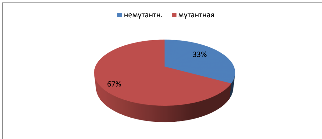
Рисунок 2 - Фенофонд популяция №2 – наиболее загрязненный участок (33% растений клевера немутантные и 67% растений мутантных)

Таким образом, популяция № 2, имеющая более широкий спектр аллелей, испытывает большее мутационное давление, чем популяция № 1, характеризующаяся невысокой концентрацией аллелефонда (Рис.3. 4).