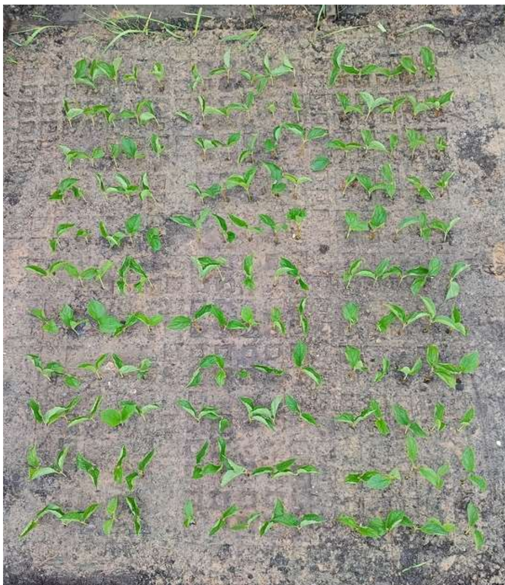
Рисунок 1 - Черенки Чубушника венечного «Spot» в теплице

Все растения, независимо от препарата были размещены в грунт. Схема черенкования разделена на 3 секции по 5 полос в каждой в 2-х повторностях. Площадь под посадку одного черенка составила 16 см 2 , в соответствии с этим объем питания под 1 черенок составляет 80 см 3 . Количество черенков в каждой секции равно 55, всего на 3 секциях для каждого вида пришлось 165 черенков. (рис.1)