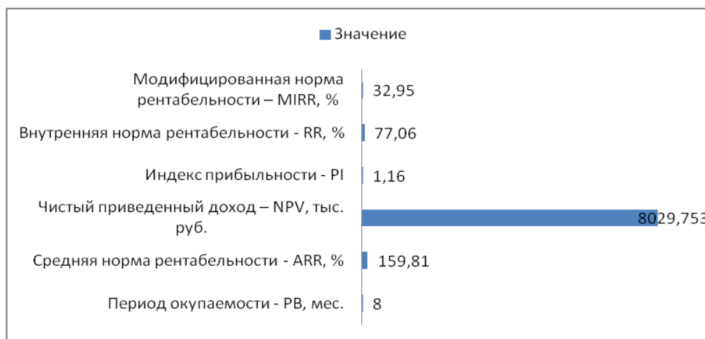
Рисунок 3 - Эффективность инвестиций в мероприятия по совершенствованию системы сбыта в организации

При условии использования инвестиционных средств для реализации проекта период окупаемости составит 8 мес. Показатели экономической оценки инвестиций в рисунке 3.