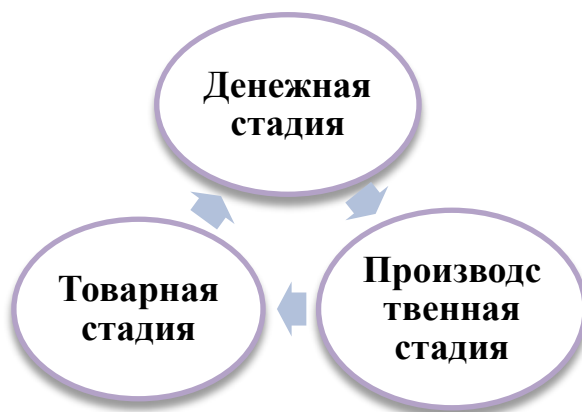
Рисунок 1 - Схема движения оборотных средств

На третьей стадии получается готовая продукция, в конечном итоге от ее реализации все активы приходят в обратное состояние, т.е. приобретают денежную форму.