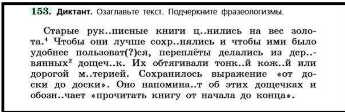
Рисунок 1 – Диктант по изученной теме

– диктант (упр. 153) по изученной теме с попутной проверкой знаний орфографии, синтаксиса и морфологии (Рисунок 1) [3];