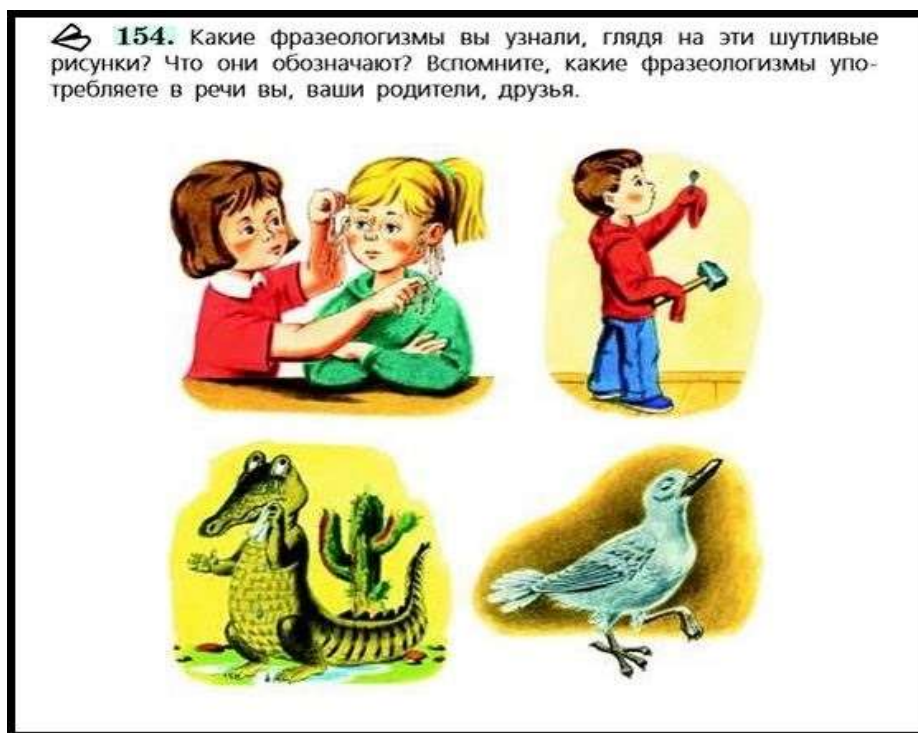
Рисунок 2 – Упражнение с заданием игрового и занимательного характера

– упражнение № 155 с заданием повышенной трудности (Рисунок 3) [3].