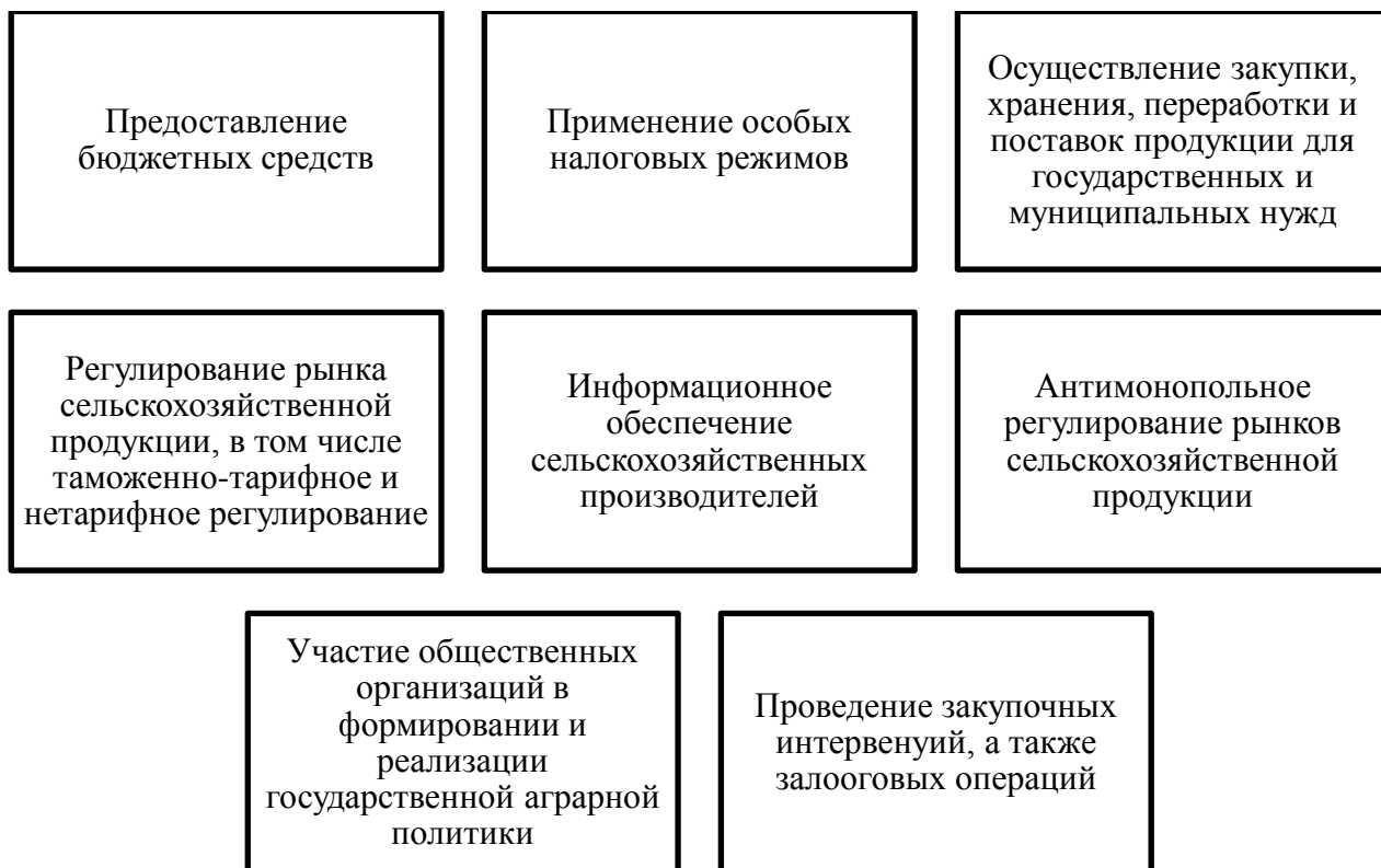
Рисунок 3 – Меры по реализации государственной аграрной политики

В современных условиях особую актуальность приобретает государственная поддержка сельхозпроизводителей путем применения к ним особых налоговых режимов. Специальные налоговые режимы предусматривают такой порядок налогообложения, при котором отдельным категориям налогоплательщиков и плательщиков сборов предусматриваются особые преимущества – налоговые льготы. К специальным налоговым режимам, в соответствии с 18 статьей Налогового кодекса РФ, относят, в том числе, систему налогообложения для сельскохозяйственных товаропроизводителей, а именно единый сельскохозяйственный налог (ЕСХН) [29]. Единый сельскохозяйственный налог освобождает от таких налогов как: налог на прибыль организаций и налог на имущество организаций. Налоговой базой признается денежное выражение доходов, уменьшенное на величину расходов. Налоговая ставка составляет 6%. Законами субъектов Российской Федерации она может быть уменьшена до 0%. Данный режим налогообложения действительно привлекателен для сельскохозяйственных производителей.