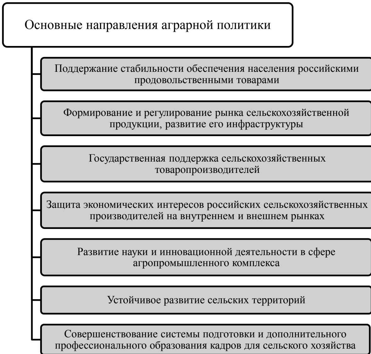
Рисунок 2 – Основные направления государственной аграрной политики

Аграрная политика направлена на поддержку сельскохозяйственных производителей, развитие сельских территорий, на развитие научной деятельности в данной сфере, а также обеспечение качественного обучения кадров, занятых в сельском хозяйстве [10].