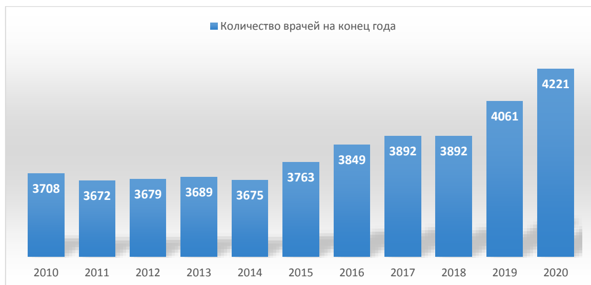
Рисунок 1 – Динамика количества медработников в Тамбовской области

поликлиники Тамбова и Мичуринска также испытывают кадровый голод, по этой причине нагрузка на врачей становится больше, ситуацию усугубляет распространение на территории области новой коронавирусной инфекции, в следствие чего в разы увеличивается число обращений за медицинской помощью. На опыте государственной программы «Земский доктор» администрация региона решила исправить ситуацию с дефицитом кадров в областном центре и городе Мичуринск, предложив выплаты миллиона рублей новым участковым врачам. Для проверки эффективности данного решения обратимся к статистике и рассмотрим динамику количества врачей в Тамбовской области с 2010 по 2020гг.