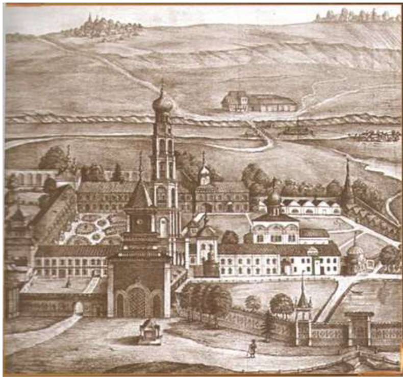
Рисунок 6 - «Вид Николо-Угрешского монастыря в 1873 году». Хромолитография

самим великим князем Андреем Боголюбским; но особой славой, до сих пор не утраченной, пользуются «вишенники», т. е. вишневые сады, разведенные в вышеупомянутых местах, и специально владимирские, вплоть до середины текущего столетия культивировавшиеся так же, как за 700 лет назад. Самые лучшие, но и самые нежные из владимирских вишен, не выносящие даже близкой перевозки, называются «васильевскими» и растут в Патриаршем саду; название сада и сорта относят к тому, что вишни эти, по преданию, перенесены сюда в начале XVII столетия неким грузинским патриархом, а взяты с родины святого Василия Кесарийского; второй сорт — «родительские» вишни: темные, почти черные — более выносливы; только этот сорт и поступает в продажу. Сам Патриарший сад, а также Добросельский — разведен московскими митрополитами Петром и Алексеем, первоначально пребывавшими во Владимире [3-5,10,11].