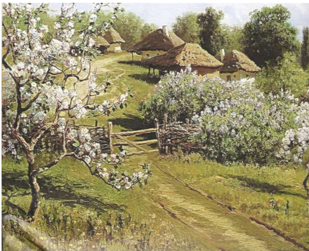
Рисунок 3 - Николай Сергеев. «Яблони в цвету. В Малороссии». 1895. Областной художественный музей, Томск

доказывает следующая цитата из славянского перевода Библии: «Сотворих ми вертограды и сады» (Экклес. XI, 5), т. е. наделали себе садов и зверинцев. Значение сада в смысле зверинца следует, однако, понимать не как звериный парк, а в смысле садка. Дело в том, что старинные хозяева содержали и разводили в саду не только овощи и плодовые деревья, но и рыбу, для которой имелись особые пруды. Так, например, в делах Окружной палаты 1146 года встречается на Пресне «Государев рыбный сад»; Котошихин упоминает, что живую рыбу для царского обихода держат на Москве «в садех». Следовательно, выражение «садовницы» («садовники»), встречающееся в грамоте В. К. Симеона (1341), явно обозначает рыбаков и сторожей при рыбных садках. В сказанной грамоте садовник поставлен наравне с «конюшим и сокольничим путем»; в грамоте князя Владимира Андреевича (1400) — с бортниками, псарями и бобровниками; наконец, в грамоте 1496 г. упоминается о «садовниках ястребья», т. е. о лицах, сажавших ястребов (Собрание государственных грамот и договоров, I, 322) [4-6,8,10].