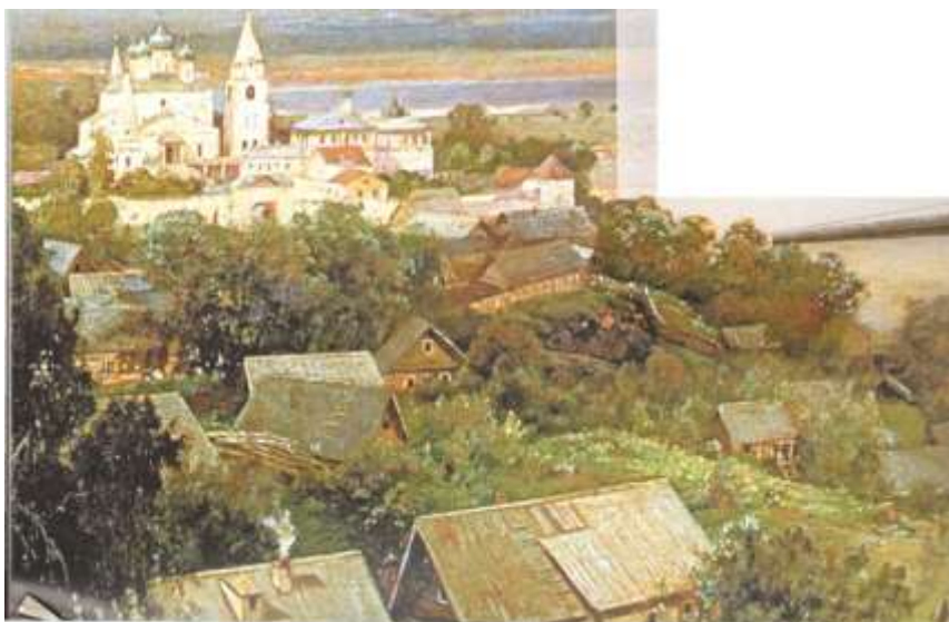
Рисунок 1 - Алексей Саврасов. «Печерский монастырь близ Нижнего Новгорода». 1871. Государственный художественный музей, Нижний Новгород

В средневековой России до XVI века включительно первое место в ряду садов (как и на Западе, до Итальянского Возрождения) занимают монастырские сады. «В старые годы, в прежние, в те времена первоначальные» в России, как и во всей Западной Европе, обитель была не только нравственным и политическим убежищем, открытым всемогущей Церковью всем, кто нуждался в ее покровительстве или защите; не только житницей и сокровищницей, куда стекались несметные сокровища; не только архивом для летописей и источником теоретического и практического знания, но и примерным сельскохозяйственным учреждением, имевшим значительное влияние на весь окрестный люд. Забелин, Дубенский, Тонин и многие другие положительно утверждают, что греческие миссионеры, отправившиеся в «обширную Скифию и страну Гипербореев» проповедовать христианство, были в то же время и создателями русских садов. Это не совсем точно: судя по многим археологическим памятникам, монахи, будучи провозвестниками общей цивилизации и бесспорно принеся огромную пользу в смысле агрономического развития, тем не менее вовсе не создали русского садоводства: уже до них каждый древний славянин из мало-мальски зажиточных имел свой «оград»; но монастыри придали садам несколько иное значение [1,2,8-9].