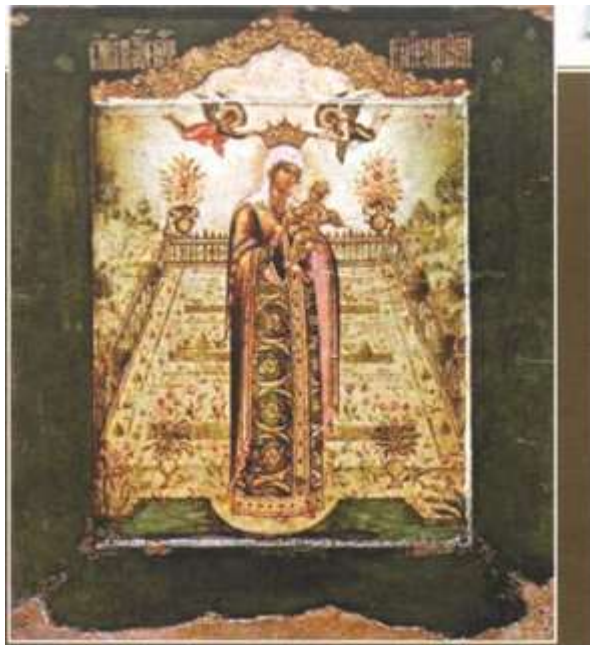
Рисунок 2 - Никита Павловец. «Вертоград заключенный». Около 1670. Государственная Третьяковская галерея, Москва.

«Вертоград заключенный» — икона Богородицы письма иконописца Оружейной палаты Никиты Павловца; в Православной церкви икона Богородицы «Вертоград заключенный» почитается как чудотворная. Сад на иконе, расположенный позади Богородицы, соответствует регулярному стилю и явно написан под влиянием многочисленных русских дворцовых и боярских садов, современных иконописцу. Ближайшим прототипом запечатленного на иконе сада называют Царицын луг в Замоскворечье [3-5,7].