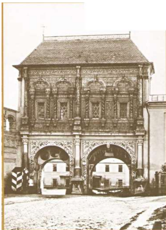
Рисунок 7 - Крутицкое Патриаршее подворье (Крутицкий терем).1884. Фотография

Понятно, что не все монастырские сады отличались такой роскошью и комфортом, но и более скромные вертограды были настолько хороши, что приводили в восхищение набожных царей и цариц, посещавших обитель. Тогда же явилось и соревнование: возникли сначала царские, а там, конечно, и боярские сады, по возможности, близко соответствующие монастырским; в конце концов обыватели последовали тому же примеру, и в результате вся Москва запестрела садами. Но этого мало: монастыри повлияли и на крестьянское население, которое благодаря им усердно принялось за плодоводство и огородничество, так что, — пишет Дубенский, — «из-за стен сих рассадников христианства и образования в народе русском постепенно распространялись сады и в окрестном населении, боярском и крестьянском, составляя ныне обширную и выгодную отрасль сельского хозяйства, как и огороды» [3,4,8-9].