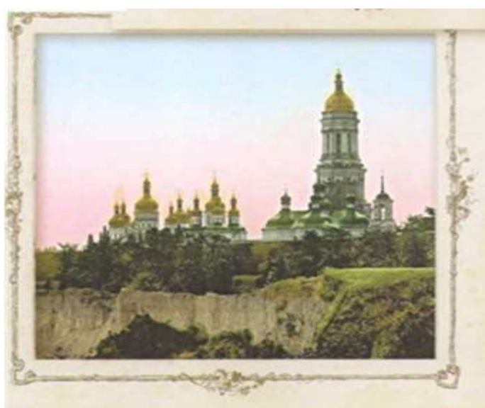
Рисунок 4 - «Общий вид Киево-Печерской лавры». Почтовая открытка

В исследовании И. А. Шляпкина «Св. Дмитрий Ростовский и его время (1651-1709)» встречается следующее описание Киево-Печерской лавры: «келлии, красивые и чистые, с широкими окнами, выходили в отдельные садики... Со стороны монастыря, в улице, были расположены два прекрасных сада, а в них живые изгороди из растений вроде желтого жасмина, с