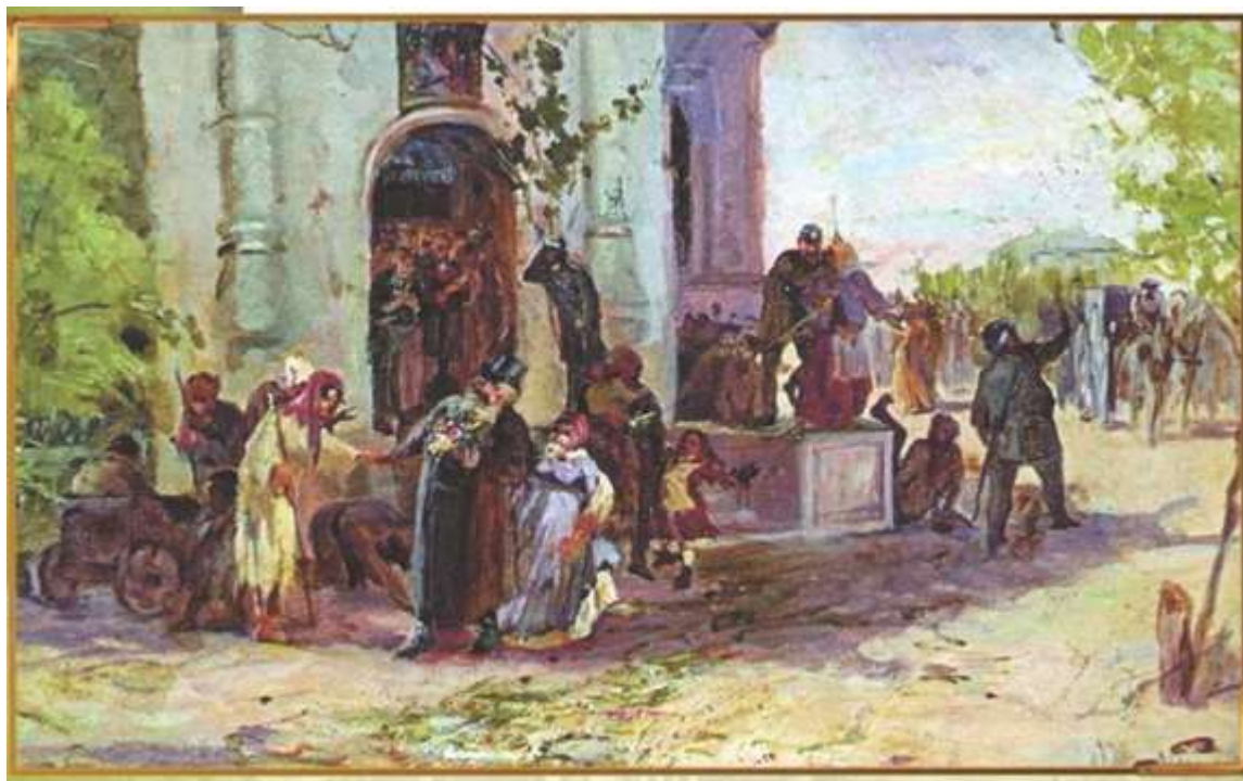
Рисунок 5 - Михаил Нестеров. «Троицын день». 1881. Эскиз неосуществленной картины.

ягодами, похожими на виноград (т. е. крыжовник), виноградники, дававшие хорошее красное вино, и массы ореховых, абрикосовых и тутовых деревьев» [6,7,10].