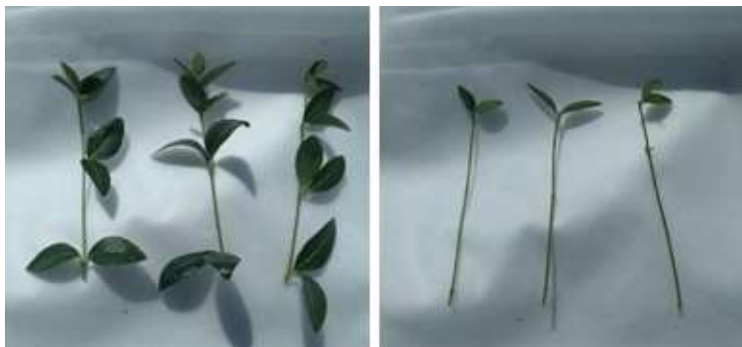
Рисунок 1 – Подготовка черенков барвинка малого

Черенки были нарезаны и подготовлены к посадке 8 июля 2021 года. В этот период условия являлись наиболее оптимальными, так как стояла пасмурная погода, что благоприятно сказывается на качество используемого материала (рис. 1).