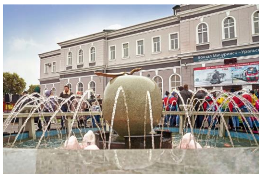
Фонтан «Мичуринское яблоко» на Привокзальной площади г. Мичуринска

На территории города расположено немало объектов с изображением яблока. Так, на Привокзальной и Центральной площадях Мичуринска установлены фонтаны с экспозицией в виде яблока, выполненного из гранита.