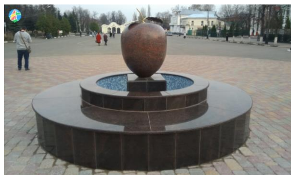
Фонтан «Яблоко» на Центральной площади г. Мичуринска

Один из центральных городских арт-объектов – яркая инсталляция «Я люблю Мичуринск», которая также содержит символическое изображение яблока.