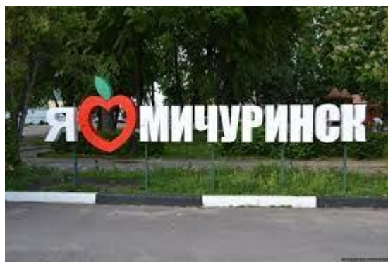
Инсталляция «Я люблю Мичуринск» на Центральной площади г. Мичуринска

Яблоко – символ и учебного заведения, в котором я учусь, – Мичуринского государственного аграрного университета. Первоначально это был институт селекции плодово-ягодных культур, открытый в 1931 г. по инициативе И.В. Мичурина. В 1934 г. его переименовали в Плодоовощной институт имени И.В. Мичурина. В 1994 г. институт стал сельскохозяйственной академией, а в 1999 г. академия получила статус университета. В настоящее время, как и прежде, наш университет – это не только образовательная организация, но и площадка для научных исследований. Мичуринский аграрный университет является одним из лидеров в России по созданию клоновых подвоев яблони.