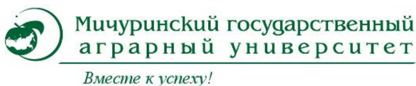
Логотип Мичуринского государственного аграрного университета

Яблоко – символ и учебного заведения, в котором я учусь, – Мичуринского государственного аграрного университета. Первоначально это был институт селекции плодово-ягодных культур, открытый в 1931 г. по инициативе И.В. Мичурина. В 1934 г. его переименовали в Плодоовощной институт имени И.В. Мичурина. В 1994 г. институт стал сельскохозяйственной академией, а в 1999 г. академия получила статус университета. В настоящее время, как и прежде, наш университет – это не только образовательная организация, но и площадка для научных исследований. Мичуринский аграрный университет является одним из лидеров в России по созданию клоновых подвоев яблони.