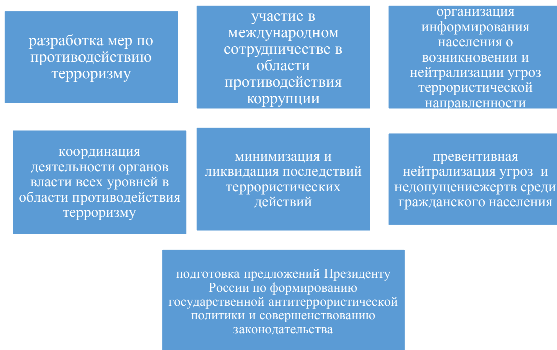
Рисунок 1 – Основные задачи Национального антитеррористического комитета

С 2006 по 2021 гг. Национальным антитеррористическим комитетом проведено 87 заседаний, из них 13 — выездных в субъектах Российской Федерации, расположенных в Южном, Северо-Кавказском и Дальневосточном федеральных округах. В условиях пандемии в 2020 году внедрена новая форма проведения заседаний НАК с применением закрытой видео-конференц-связи. Такая организация заседаний позволила обеспечить безопасность и бесперебойный характер работы Комитета в условиях распространения коронавирусной инфекции (COVID-19) [8].