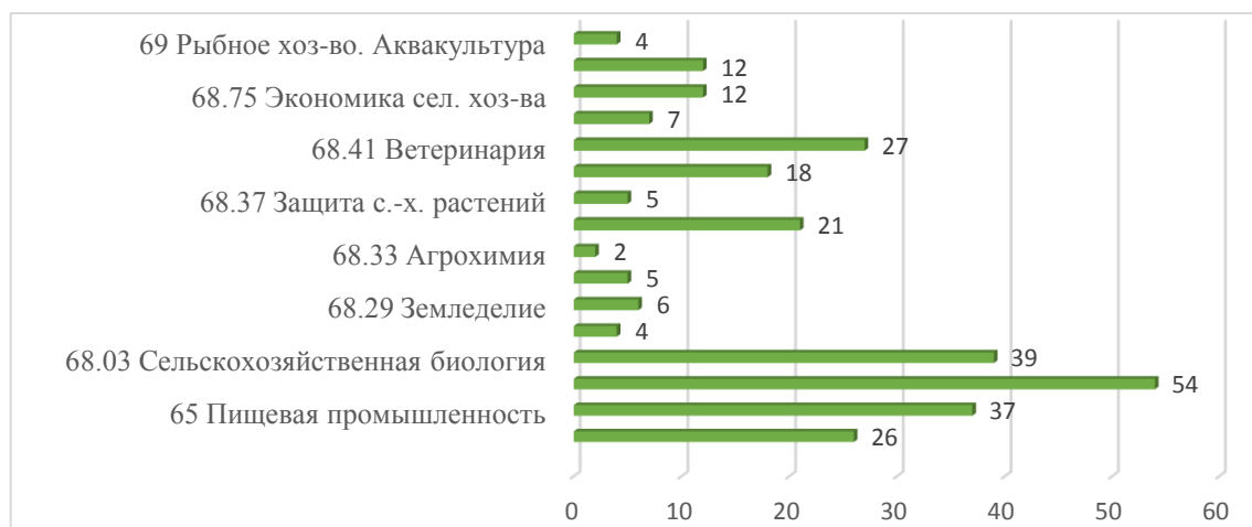
Рисунок 2 - Распределение журналов в названиях по тематике в 2020 г.

Современное состояние сельскохозяйственной науки и образования вносит постоянные коррективы в издательскую политику учредителей журналов. Документопоток журналов динамичен. Все основные отрасли АПК имеют специализированные журналы. Наибольшее количество журналов выпускается по сельскохозяйственной биологии, растениеводству, животноводству, ветеринарии, пищевой промышленности. Под разделом общие вопросы сельского хозяйства собраны многоотраслевые журналы (Рис. 2).