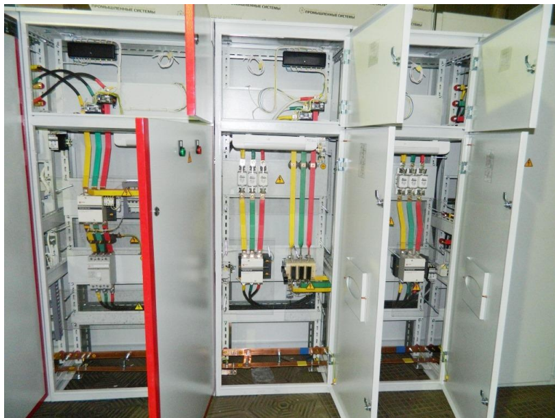
Рисунок 1 – Внешний вид шкафов управления электроприемников

Третья категория – все остальные электроприёмники, не подходящие под определение первой и второй категорий [4].