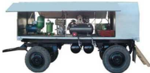
Рисунок 4 - Передвижной сервисный комплекс Казахского НИИ МЭСХ

Данный комплекс можно также считать агрегатом технического обслуживания, поскольку он предназначен для проведения работ по техническому обслуживанию, диагностированию и устранению неисправностей сельскохозяйственной техники в полевых условиях.