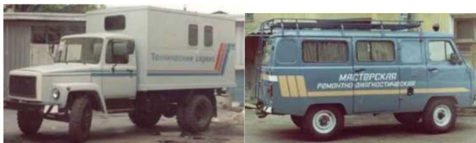
Рисунок 1 - Передвижной ремонтно-диагностический пост КИ-28016.02: а - на шасси автомобиля ГАЗ-3307; б - на автомобиле УАЗ

Взамен старых мастерских полевого ремонта ГОСНИТИ разработал и организовал производство ремонтно-диагностической мастерской «Техсервис МТП», известной как ремонтно-диагностический пост КИ-28016.02 [1]. Данный пост может быть смонтирован на шасси автомобилей ГАЗ, УАЗ, ЗИЛ или «Газель» (рис. 1) [2, 3].