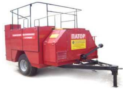
Рисунок 3 - Агрегат ТО и ремонта ПАТОР а) на шасси ГАЗ-3307; б) на двухосном полуприцепе; в) на одноосном полуприцепе

Агрегат ПАТОР предназначен для выполнения технического обслуживания, ремонта и подготовки машин к длительному хранению, обеспечения первичных мер пожарной безопасности объектов жилищно-коммунального и дорожного хозяйства в полевых условиях. Агрегат «ПАТОР» может быть укомплектован диагностическими приборами и инструментом для выполнения плановых технических обслуживаний по желанию заказчика, в таком варианте с его помощью можно полноценно выполнять регламентные операции ТО машин [4, 6-8]. Для перемещения и привода в действие оснастки агрегата ПАТОР, выполненного на базе полуприцепов, требуется трактор класса 1,4. В зависимости от целей и задач стоящих перед эксплуатирующими агрегат службами производитель предлагает серию модификаций ПАТОР: ПАТОР-С (стандартный), ПАТОР-ЭУ (с энергоустановкой) и ПАТОР-А (автономный).