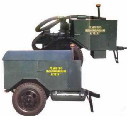
Рисунок 5 - Прицепной агрегат ПРОА-1 (ВНИПТИМЭСХ)

Разработкой прицепных агрегатов для ТО и ремонта машин и исследованием их применения в условиях механизированных подразделений хозяйств занимались сотрудники ВНИПТИМЭСХ Агафонов Н.И., Чупринин Н.И. и Курочкин В.Н. [2, 9], а также Дмитренко А.И. и Шевченко С.О. [2]. В настоящее время разработка данного института - прицепной агрегат техобслуживания ПРОА-1 выпускается серийно ОАО «Ставропольсельмаш» (рис. 5).