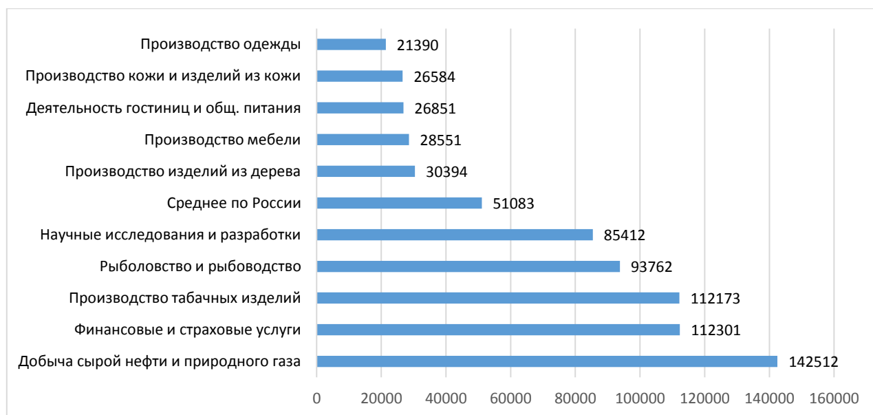
Рисунок 1–Уровень среднемесячной номинальной начисленной заработной платы работников организаций РФ в наиболее низко и высокооплачиваемых видах экономической деятельности в 2020 г., руб.

На рисунке 1 представлены пять видов экономической деятельности с наименьшим уровнем заработной платы и пять видов экономической деятельности с наибольшим уровнем заработной платы.