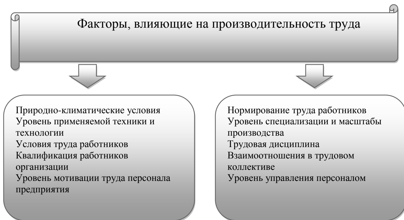
Рисунок 1 - Факторы, влияющие на производительность труда в сельском хозяйстве

На производительность труда оказывают влияние разнообразные факторы (рис.1) [1, 6, 11, 12].