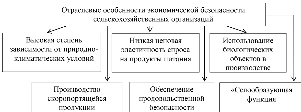
Рисунок 1 – Отраслевые особенности экономической безопасности сельскохозяйственных организаций

Сельскохозяйственная организация представляет собой часть системы связей и отношений в определенной окружающей среде, что подразумевает под собой ряд отраслевых особенностей, влияющих на обеспечении экономической безопасности такого субъекта (рис. 1).