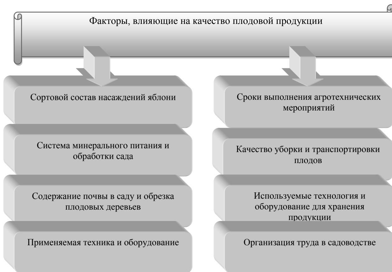
Рисунок 4 - Факторы, влияющие на качество плодовой продукции

Предложенные мероприятия будут способствовать увеличению объемов реализации продукции и прибыли сельскохозяйственной организации, росту рентабельности продаж.