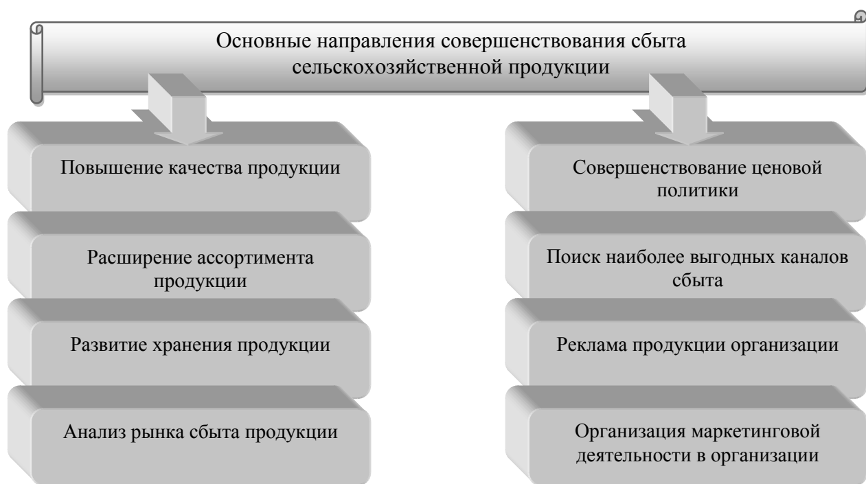
Рисунок 3 - Основные направления совершенствования сбыта сельскохозяйственной продукции

Одним из основных факторов роста эффективности реализации сельскохозяйственной продукции является повышение качества производимой продукции. Более высокое качество продукции обуславливает конкурентное преимущество сельскохозяйственного товаропроизводителя и способствует организации эффективного сбыта.