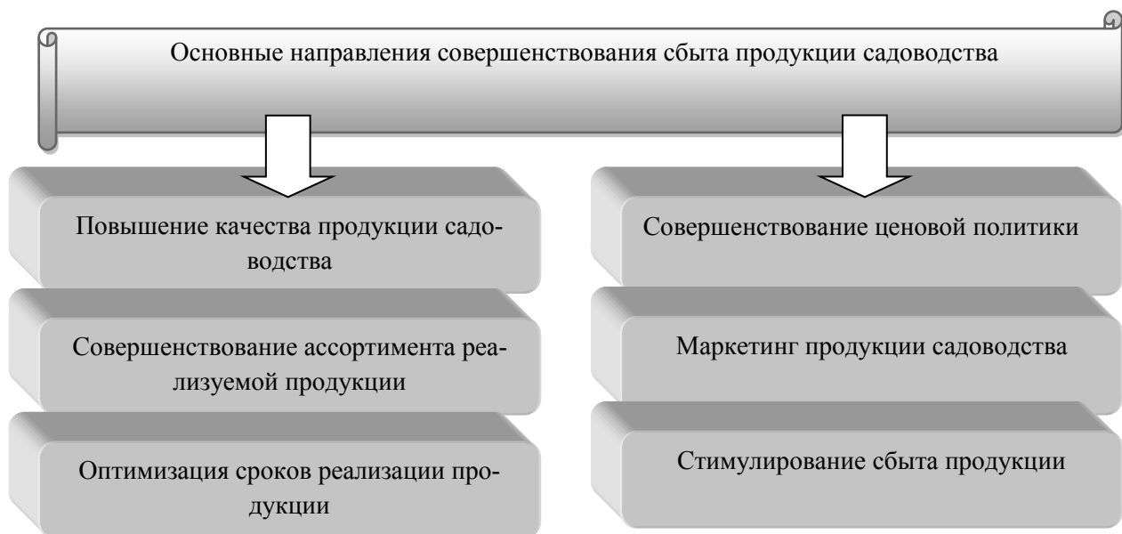
Рисунок 3 - Основные направления повышения эффективности сбыта продукции садоводства

Проведенные исследования показали необходимость совершенствования сбыта продукции садоводства. Основные направления роста эффективности сбыта продукции садоводства представлены на рисунке 3 [6, 11].