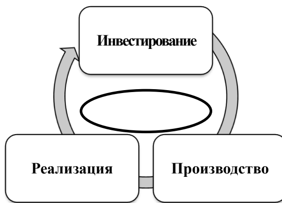
Рисунок 1 – Взаимосвязь бизнес-процессов в воспроизводстве функционирующего предприятия

Нами установлена первичность инвестиций по отношению к прибыли как цели деятельности предприятия при непосредственном влиянии конечного финансового результата на цикличность его воспроизводства. Учитывая уровень полученной и реинвестируемой прибыли, организацией создаются возможности для осуществления воспроизводства различного типа, так называемого «спиралевидного развития» с размахом по ширине и высоте колец спирали. Траектория такого развития, на наш взгляд, завязана на величине реинвестируемой прибыли и формируемом под ее влиянием уровне финансовой устойчивости. Очевидно, что за процессом инвестирования следует процесс производства, в рамках которого из денежных средств формируются производственные запасы, выплачивается заработная плата, осуществляются другие расходы и, в конечном итоге создается готовая продукция, подлежащая реализации. Итак, за процессом производства объективно следует процесс реализации, в рамках которого поступает выручка, как источник для возмещения краткосрочных и части долгосрочных инвестированных в кругооборот денежных средств, результатом которого является получение прибыли.