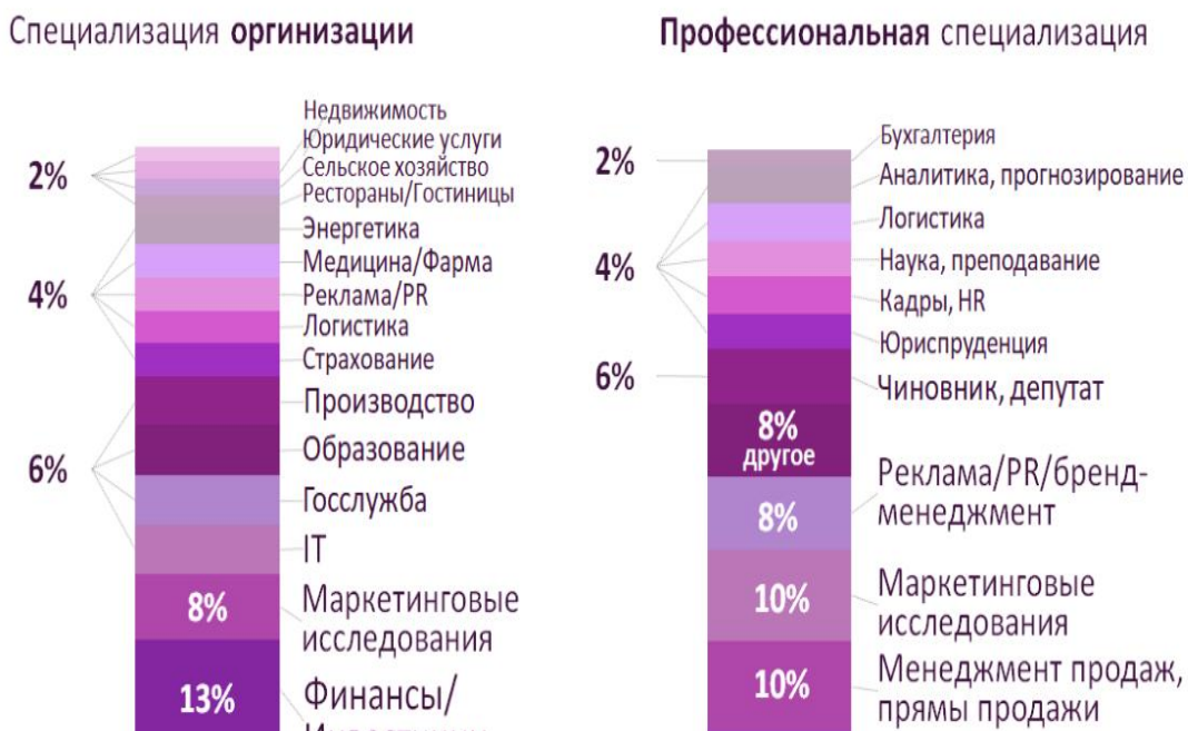
Рисунок 3-Доля работающих выпускников по профессии

специалисты, которые работают в сфере торговли и 17% в других различных сферах.