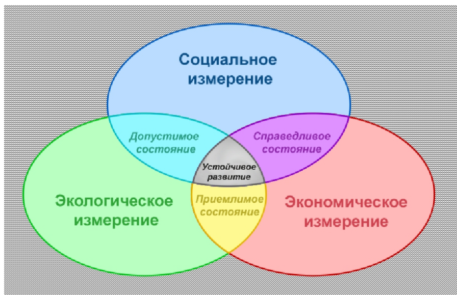
Рисунок 2-Факторы, которые влияют на устойчивое развитие

Устойчивое развитие агропромышленного комплекса — это одна из основных проблем в экономике. На устойчивое развитие агропромышленного комплекса влияют факторы, их можно увидеть на рисунке 2, который представлен ниже.