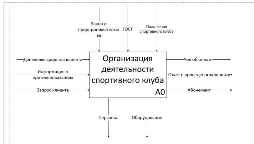
Рисунок 1 – Контекстная диаграмма

На рисунке 1 изображена контекстная диаграмма работы.