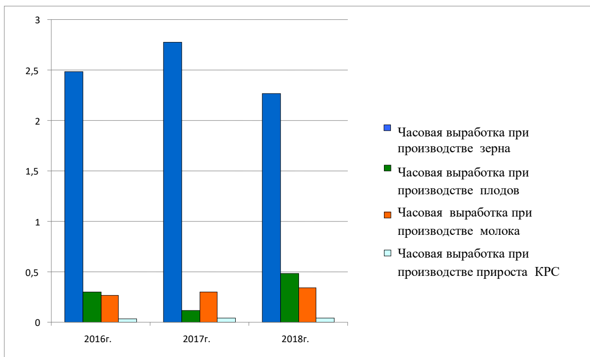
Рисунок 2 - Динамика часовой выработки при производстве основных видов продукции в АО учхоз-племзавод «Комсомолец», ц /чел.-час.

Рассмотрим динамику часовой выработки при производстве основных видов продукции в АО учхоз-племзавод «Комсомолец» Мичуринского района Тамбовской области (рисунок 2).