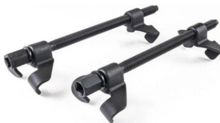
Рисунок 1 - Съёмник пружин механический