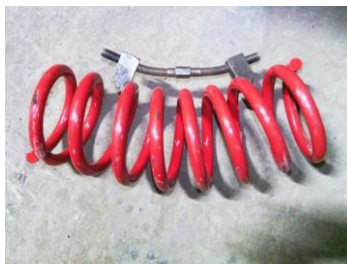
Рисунок 2 – Установка одного съемника

Установка одного съемника на пружину приведет к его поломке (рисунок 2).