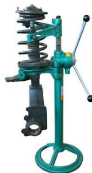
Рисунок 4 – Полустационарная стойка

Единственный недостаток – нельзя сжать пружину прямо на автомобиле, съемник работает с подвеской, снятой с автомобиля.