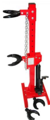
Рисунок 6 – Стяжка пружин гидравлическая

кузова автомобиля. Вся установка покрыта высокопрочной эмалью, гарантирующей максимальную защиту от коррозии и эстетичный внешний вид.