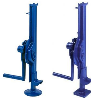
Рисунок 4 – Реечный домкрат

Механизм реечной конструкции пригодится при ремонте техники в отдаленных от сервиса условиях. Механизм можно применять в виде лебедки в сельской местности.