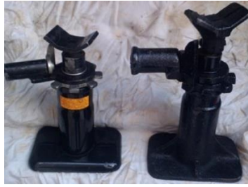
Рисунок 3 – Вертикально-винтовые домкраты бутылочного типа

Преимущества: простота устройства; грузоподъемность до 5 тонн.