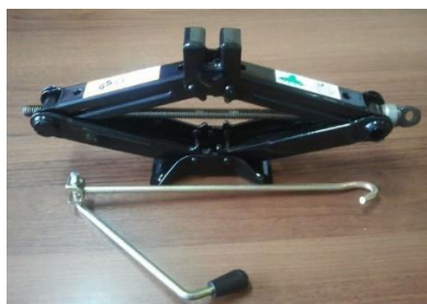
Рисунок 1 – Домкрат винтовой

Преимущества: Подъем груза осуществляется по вертикальной плоскости, не наклоняя его в разные стороны; при соблюдении максимально допустимых нагрузок - долговечен; повышенная устойчивость; ремонтпригоден, компактно складывается.