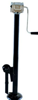
Рисунок 2 – Стоечно-винтовой домкрат

В отечественном автопроме долгое время применялись вертикальные винтовые домкраты.