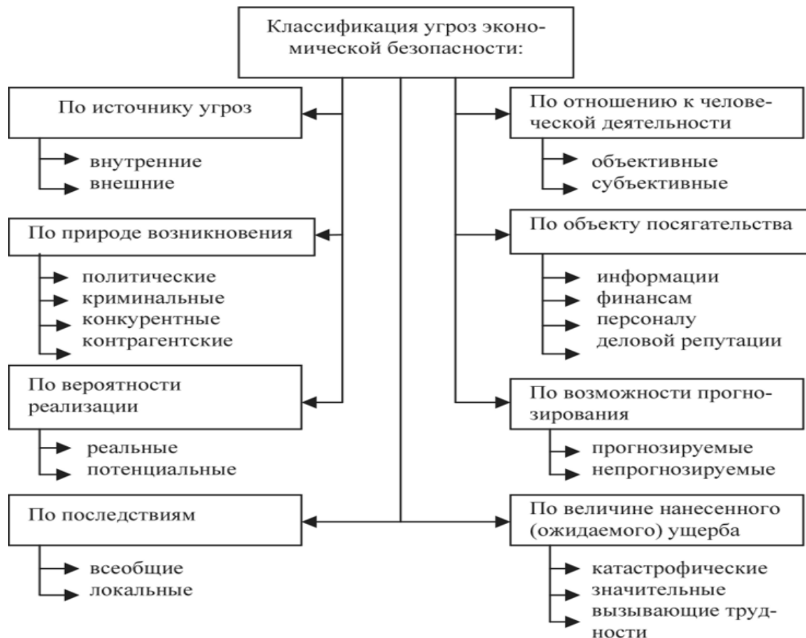
Рисунок 1 – Классификация угроз экономической безопасности предприятия.

Подробная классификация угроз экономической безопасности предприятия представлена на рисунке 1.