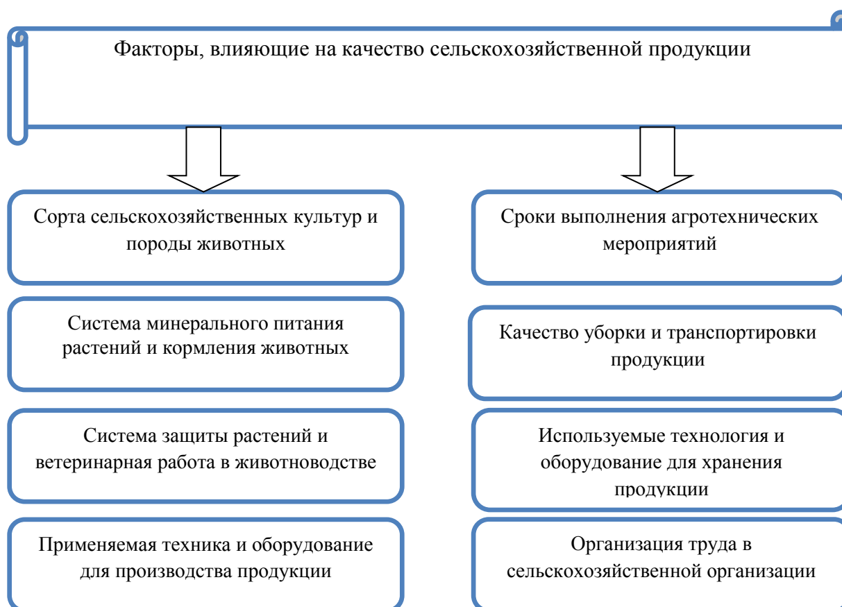
Рисунок 3 - Комплекс факторов, влияющих на качество сельскохозяйственной продукции.

В молочном скотоводстве от породы коров зависит жирность и уровень белка в молочной продукции. В садоводстве важным является не только произвести, но и длительное время сохранять качественные характеристики плодовой продукции. Важную роль здесь играет уровень применяемой технологии и оборудования. В частности, хранение плодов в регулируемой атмосфере позволяет значительно продлить срок хранения и сохранить качество продукции [3].