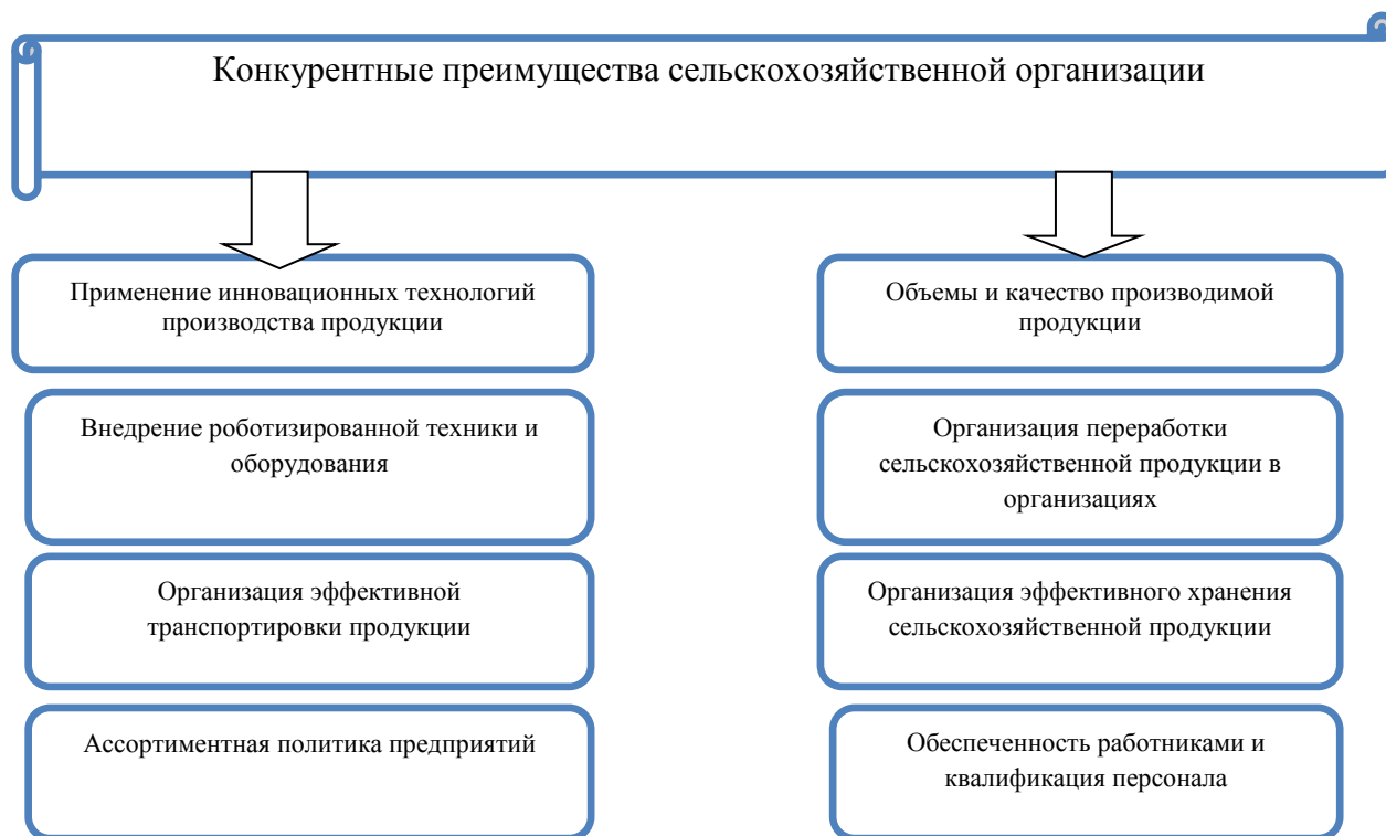
Рисунок 1 – Конкурентные преимущества сельскохозяйственной организации.

Непосредственно на стадии производства важным является прогрессивность применяемой технологии и техники, качество труда, уровень управления производством [2].